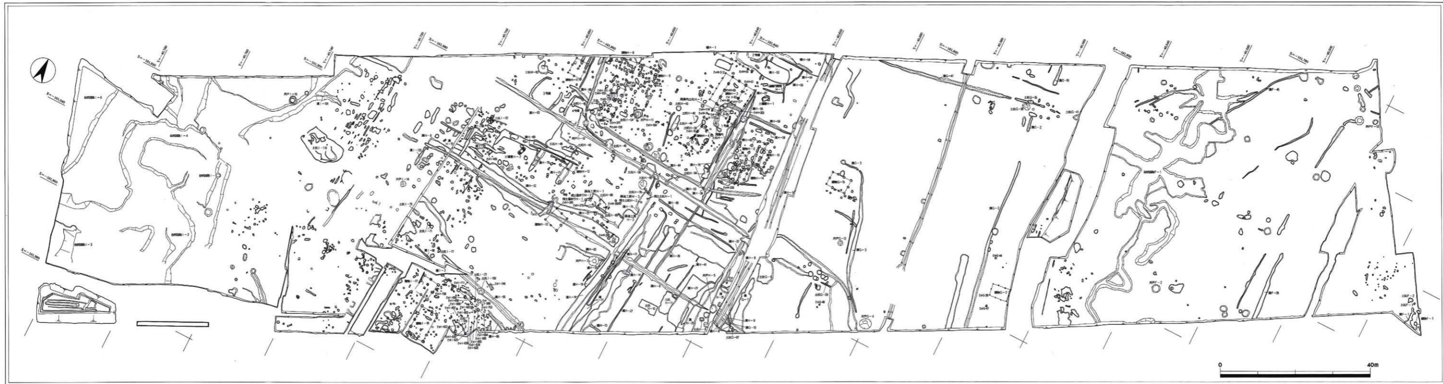
付図Ⅱ-1 Ⅱ調査区全体図