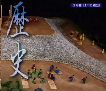
3号墓 (1/10 模型)

1800年もの昔から 弥生の出雲王がねむる西谷墳墓群。 その史跡公園のとりに弥生の森博物館が平成22(2010)年 4月にオープンしました。 発掘された「王墓」西谷3号墓を出土品と模型でとことん解明! 他にも、最新の発掘成果がいろいろ。 古代出雲が見える、さわれる、実感できる!