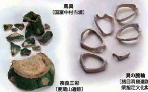
馬具 (国富中村古墳)