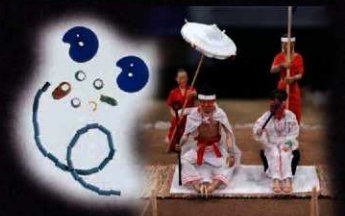
ガラス勾玉・ガラス玉・碧玉 鳥取大学考古学研究室所蔵 儀式を見守る男王と女王