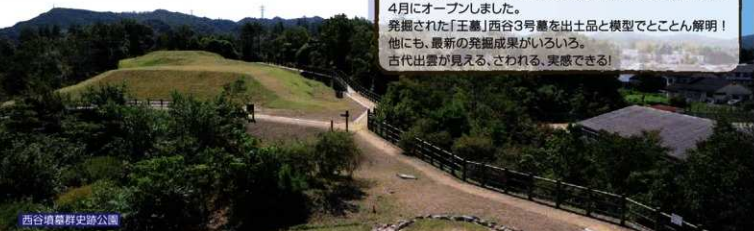
西谷墳墓群史跡公園