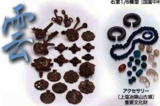
アクセサリー (上塩治築山古墳) 重要文化財