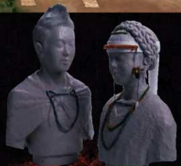
男王と女王のアクセサリー復元