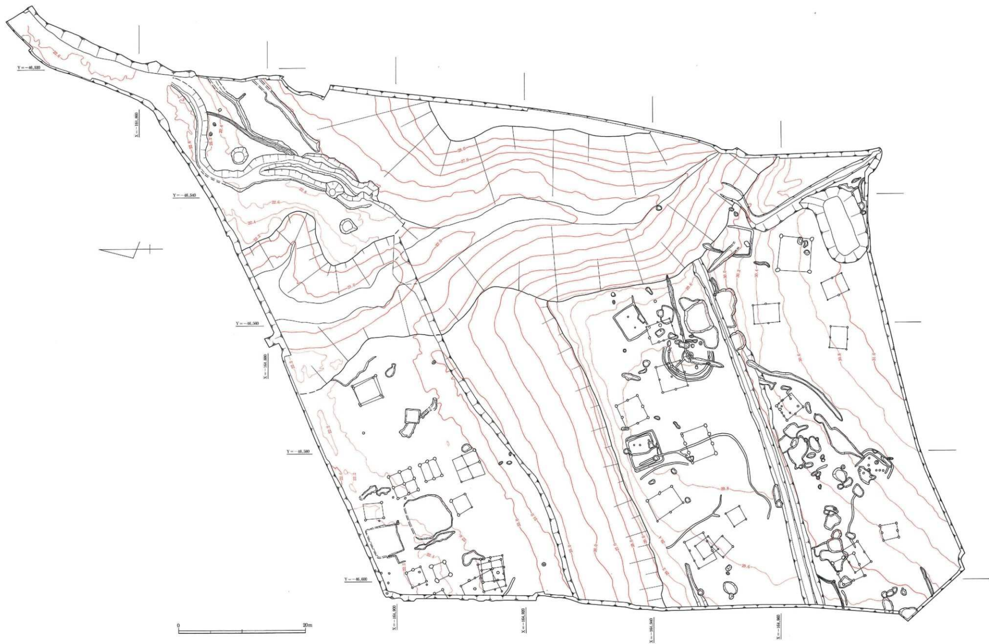
付图1 第I区 遺構全体图