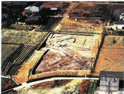
(2) D2・3調査区遠景(東から)