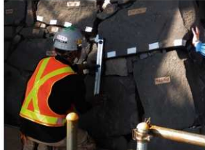
② 石垣墨打ち・番付作業 元位置に積み直すために隣り合う石材に印を付けます。