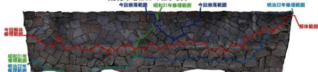
H618-1 修復履歴図 (復旧完了後)