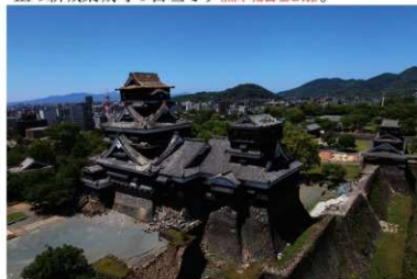
大小天守石垣被書状況(東北東から)