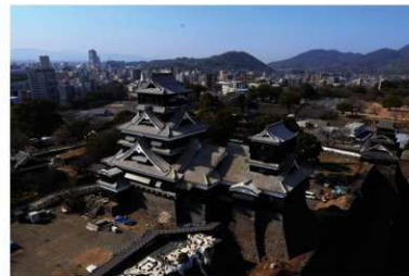
大小天守石垣復旧完了状況(東北東から)