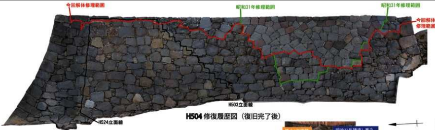
H504 修復履歴図 (復旧完了後)

小天守石垣 H503・H524 を解体修理した際に、昭和 35 年天守再建に伴う積み直し時以来、60 年ぶりに天守北面の埋没石垣【H524 立面線～H503 立面線】を確認しました。