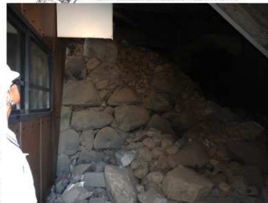
大天守穴蔵石垣崩落状況

■熊本城石垣色 ①(1599～1591年頃) ■熊本城石垣色 ②(1599～1600年頃) ■熊本城石垣色 ③(1606～1607年頃) ■熊本城石垣色 ④(1611～1624年頃) ■熊本城石垣色 ⑤(1625～1632年頃、加藤期修理) □熊本城石垣色 ⑥(編入期修理)・7期(近代修理)