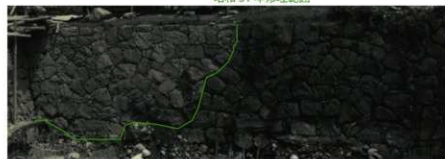
H618-1 昭和 35 年工事写真

南面～西面の天守外側石垣際には、明治 10 年 (1877) の西南戦争で天守が焼失した際の焼土が残存し、その下には熱を受けた栗石を確認しました。江戸期の裏込めは拳丈～人頭大の内礫が使用されていました。さらに、南面～西面南側にかけは、明治 22 年熊本地震で崩落・変状した石垣修理範囲を確認しました。明治 22 年積み直し範囲の裏込めには円礫に加えて、角礫・旧築石・大量の瓦や土が含まれていました。昭和 31 年修理範囲の裏込め内では通路として使われていた時の側面石垣を確認しています。