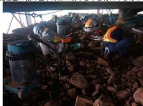
⑤ 裏込め清掃作業 解体途中で清掃作業を行ない、石の積み方を記録します。