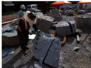
⑥ 築石新補石材加工作業 ※新材確保は調査に基づき厳選。 損傷がひどく、再利用できない石を新材で補います。