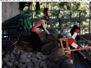
⑧ 積み直し作業（築石） 解体前の写真等を参考に築石を積み上げます。