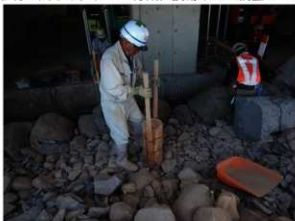
⑦ 積み直し作業（裏込め） 裏込めもすべて手作業で施工します。