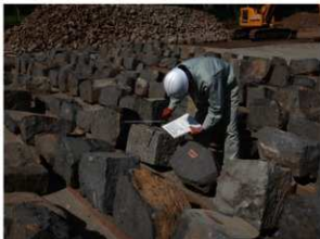
④ 築石石材調査 石材の大きさ、加工の特徴、損傷などを調査します。