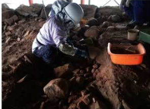
① 大天守石垣上面発掘調査 石垣の解体範囲を調査し記録します。