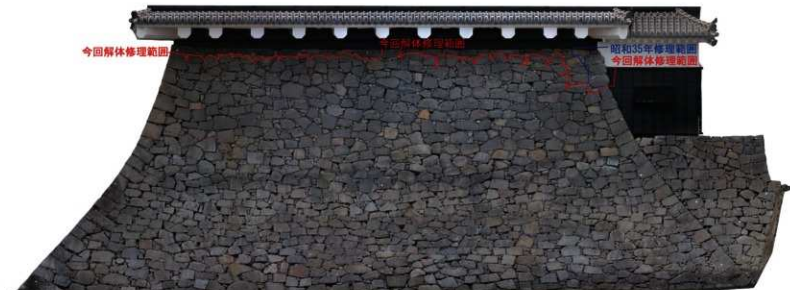
H516 修復履歴図 (復旧完了後)