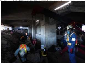
③ 石垣解体作業（築石） 大天守穴蔵内部は狭く、解体作業は難航しました。