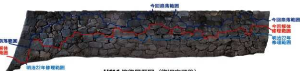
H616 修復履歴図 (復旧完了後)