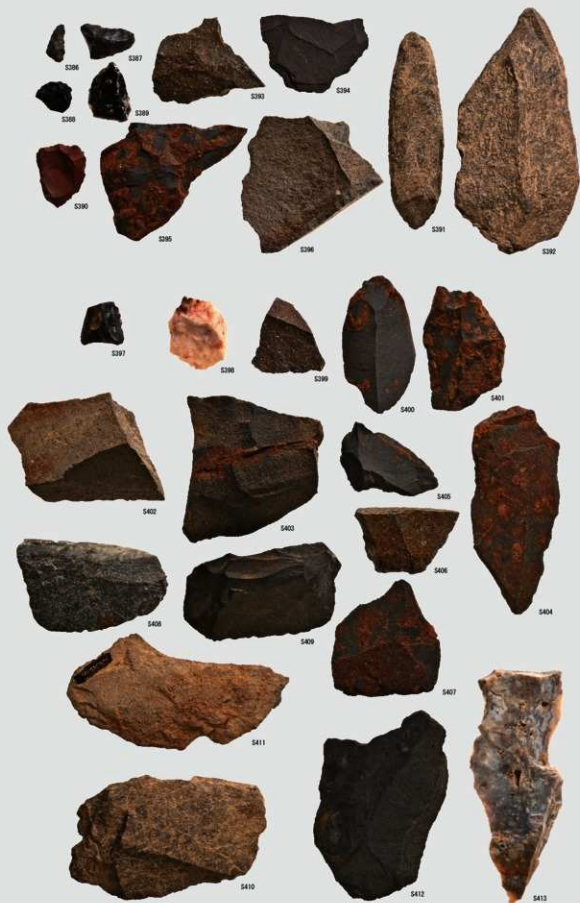
二次使用痕剥片·使用痕剥片