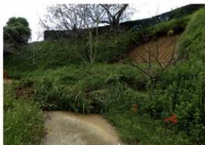
本丸の斜面崩落状況

斜面の崩落土から戦国時代末期に葺かれた瓦や江戸時代の陶磁器や瓦が見つかっています。本丸、西の丸に存在した建物に葺かれた瓦や城内で使われた陶磁器が斜面に落ちたものと考えられます。