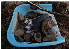
崩落土から出土した遺物