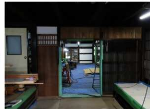
復元整備が進む主屋内部