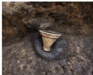
竪穴住居跡内から見つかった高環の一部

めいお いんれき ながやこでがや 明和9年(1772)5月21日(陰暦)、現在の長谷小出ヶ谷地区において どうたくいっく 銅鐻二口が発見され、掛川藩に届け出されました。掛川市では、この 日を記念して、市民の埋蔵文化財に対する理解と保護・保存しようとする 意識の向上を願い、出土文化財展を開催しています。