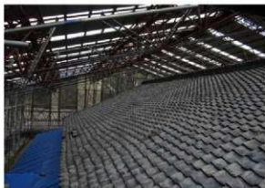
令和2年 解体調査前の屋根

文化財建造物の修復ですので、瓦や垂木、床板など引き続き使用できる部分は再利用して修復を進めています。また、解体調査を進めている中で、式台玄関から棟札が見つかるなど、建物の変遷を物語る貴重な発見もありました。