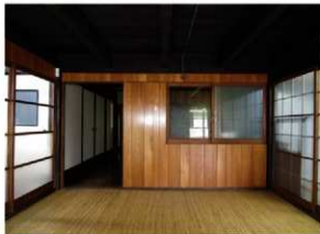
工事前の主屋内部