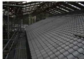
令和4年 葺き替えが完了した屋根