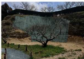
西の丸復旧工事の完了状況