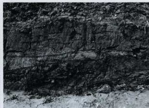
C-1区 セクション (東から)