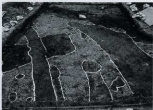
遺構検出状況（南から）