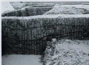
SD07① セクション (北から)