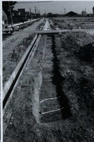
C-4区 遺構検出状況 (北から)