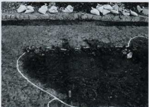
SK01 土器出土状況（東から）