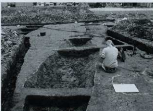
SD05 セクション (西から)