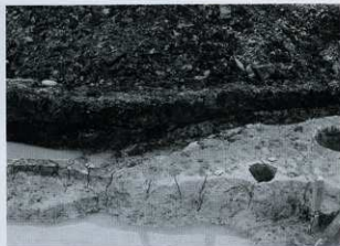
C-2区 セクション (東から)