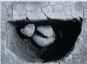
SP14 石組み出土状況 (南から)