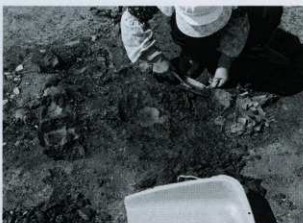
土器溜まり出土状況