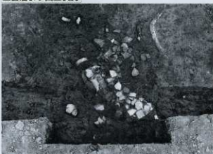
土器溜まり出土状況 (西から)