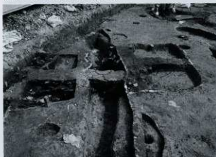
SK05・SD04 土器出土状況 (南から)