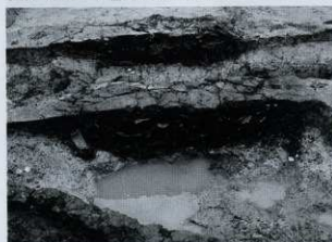
SK05 セクション (西から)