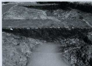
C-3区 SD01 セクション (東から)