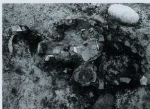
SD07① 肩部土器出土状況 (南から)