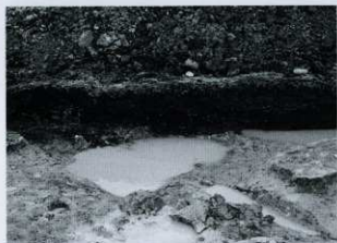
C-2区 セクション (東から)