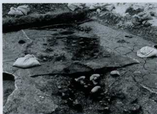
SD08 土器出土状況 (東から)