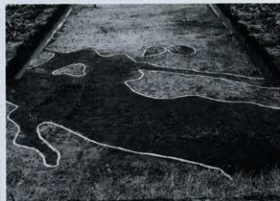
C-3区 SD01 遺構検出状況 (南から)