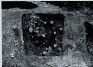
SK05 土器出土状況 (西から)