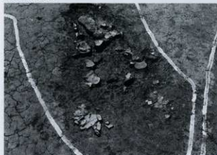
土器溜まり出土状況 (東から)