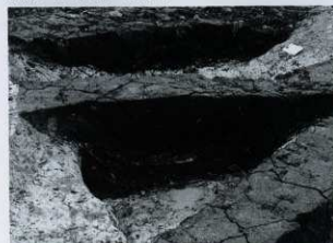
SK04 セクション (北から)