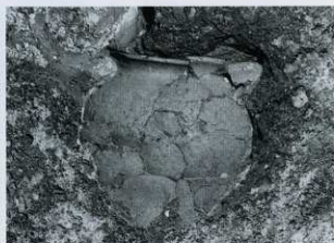
SD07① 肩部土器出土状況