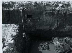
サンプリング風景