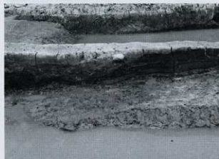
SD07② セクション (東から)