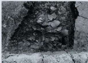
土器溜まり出土状況 (西から)