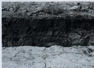
C-1区 セクション (東から)