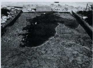
SK01 土器出土状況（北から）