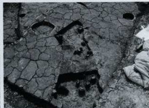
SD09 土器出土状況 (北から)