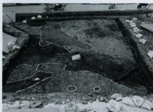
遺構検出状況（北から）