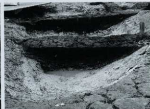
SD08 セクション (西から)