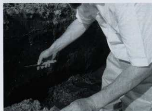
サンプリング風景