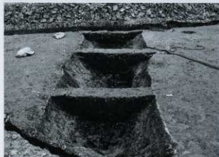
SD04 セクション (西から)