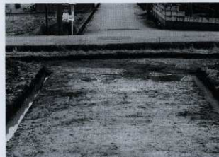
C-3区 SD01 遺構検出状況 (北から)