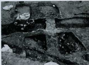
SK05・SD04 土器出土状況 (西から)