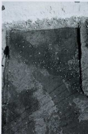
上層土器出土状況