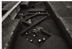
SK 5・152・153確認状況(2)(北から)