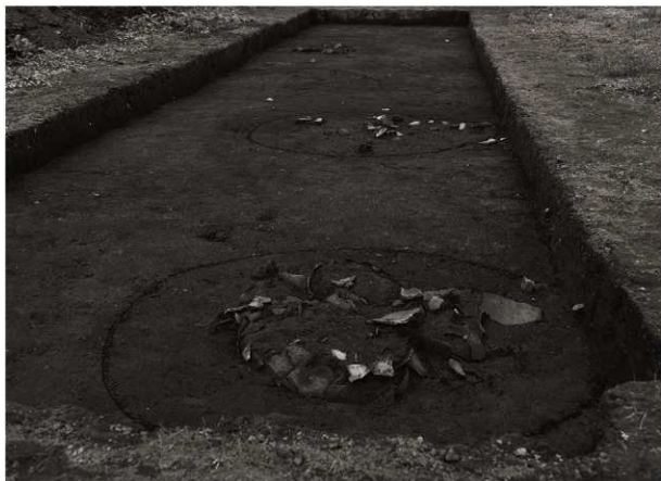
SK109・110確認状況（南東から）