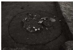
SK110確認状況 (2) (南から)