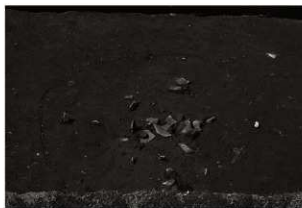
SK109確認状況 (2) (東から)