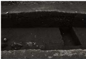
第25トレンチ西壁セクション(4)SI15付近(東から)