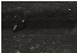
第17トレンチセクション (3) SK111付近 (南から)