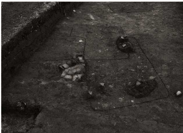
SK136確認状況 (1) (西から)