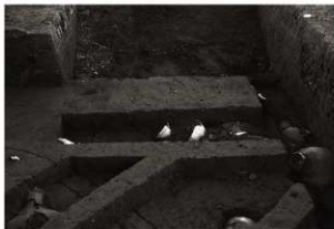
SK153セクション (北から)