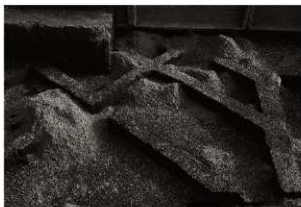
SK 5 · 152 · 153保護措置 (2) (西から)