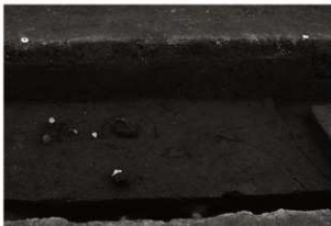
第25トレンチ西壁セクション(8) SD9付近(東から)