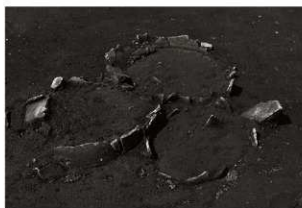
SK108確認状況（2）（東から）拡大