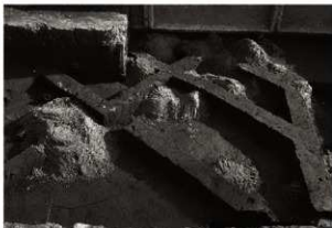
SK 5 · 152 · 153保護措置 (1) (西から)