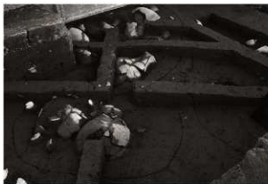
SK 5 · 152セクション (1) (北西から)