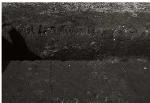
第19トレンチセクション (1) 西部 (南から)