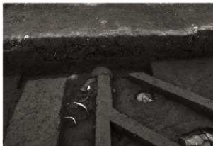
第25トレンチ西壁セクション(7) SK153付近(東から)