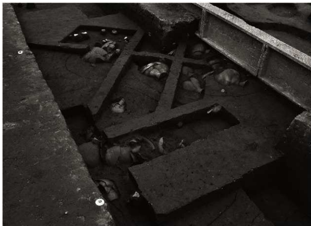
SK 5・152・153確認状況(1)(南西から)