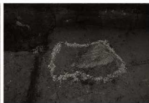
SK136保護措置 (1) (南から)