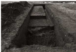
第19トレンチ全景 (東から)