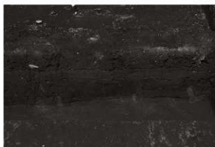
第17トレンチセクション (1) 東部 (南から)