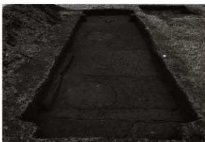
第17トレンチ全景 (東から)