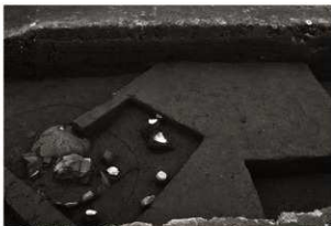
第25トレンチ西壁セクション(6) SK152付近(東から)