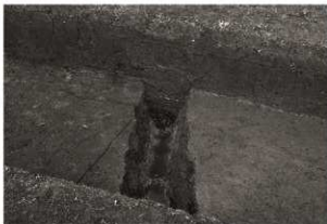
SD8 調査状況 (南から) SD9 掘削前