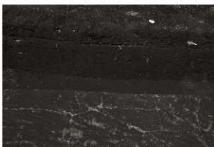
第17トレンチセクション (2) SX8付近 (南から)