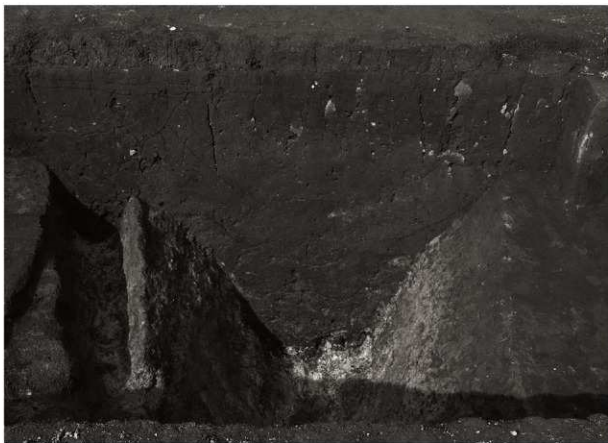
SD9 調査状況 (1) セクション (南から)