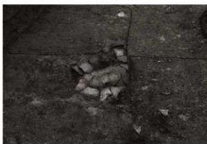
SK136確認状況 (3) (西から) 拡大