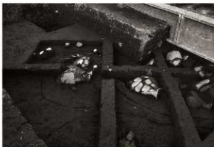
SK 5 · 152セクション (2) (南西から)