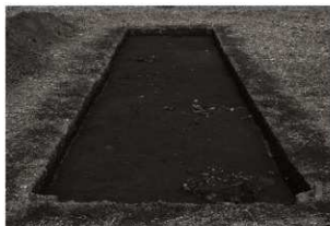
第10トレンチ1・2区全景（2）（南から）