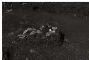
SK136確認状況 (2) (南から)