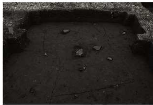
SK14・101・102確認状況 (東から)