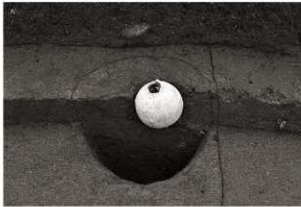
SK99セクション (北から)