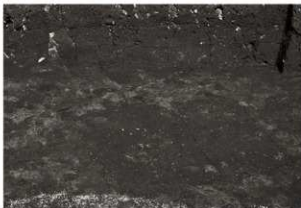
SK128・131・132確認状況(南から)