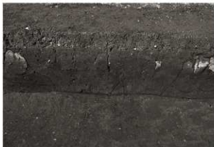
第19トレンチセクション (2) 中央部 (南から)