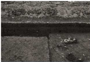
第24トレンチセクション(2) 中央部(南から)