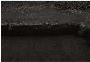
第25トレンチ西壁セクション(1)北端(東から)