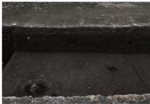
第25トレンチ西壁セクション(3)SI22付近(東から)