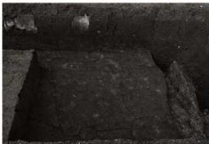
SK143・144確認状況(南から)