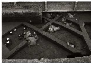
SK 5・152確認状況(西から)