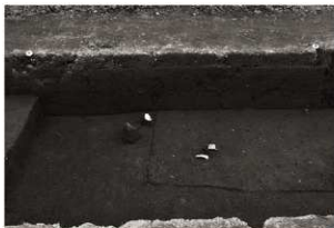
第25トレンチ西壁セクション(5) SI115南都(東から)