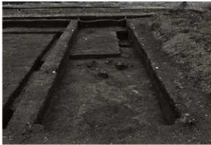
第24トレンチ全景(東から)