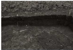
第24トレンチセクション(1) 東部(南から)