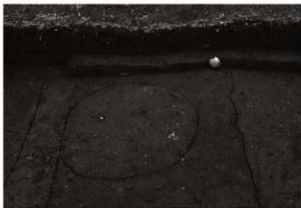
SK99・100確認状況 (北から)