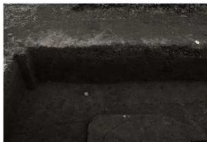
第25トレンチ西壁セクション(9) 南端(東から)