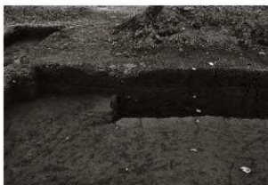
第24トレンチセクション (3) 西部 (南から)