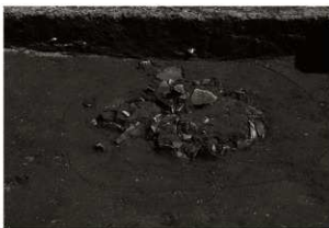
SK110確認状況 (1) (西から)