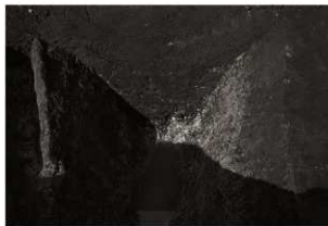
SD9調査状況(2) 底面(南から)