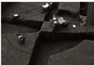
S K 83調査状況 (3) (東から)