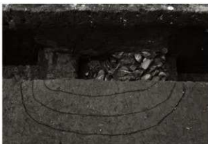
S K58調査状況 (1) サブトレンチ掘削後 (東から)