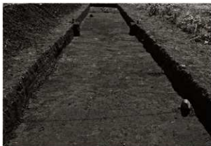
S I 11確認状況 (1) サブトレンチ掘削前 (北から)