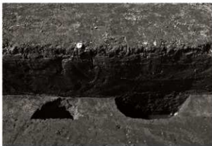
S K 54・93確認状況 (東から)