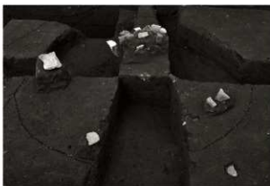
S K 83調査状況 (1) (南から)