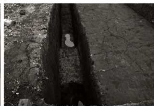
S K 65・98確認状況 (南から)