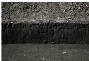
S I14セクション (1) 西部 (南から)