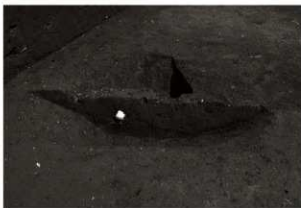
S K67調査状況 (3) (南から)