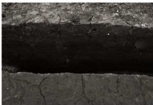
SK98セクション (東から)