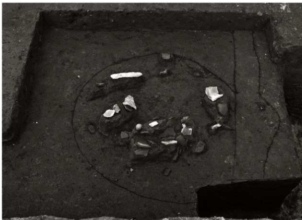
S K 83確認状況 (1) (北から)