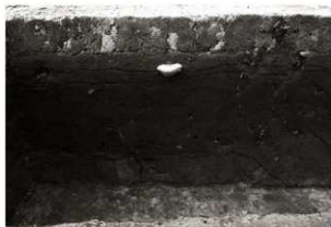
SK71セクション (1) 南部 (東から)