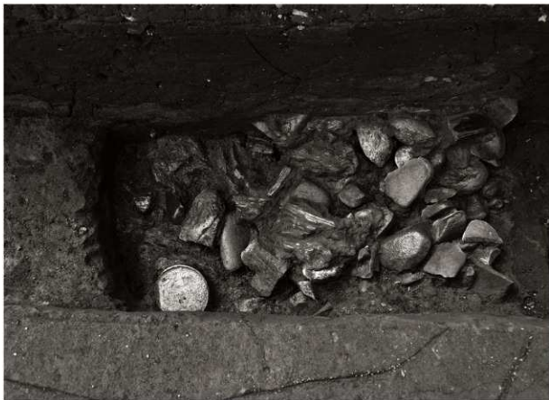
S K 58遺物出土状況 (2) (鉛直, 上が西)