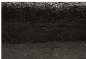
S I 17 セクション (北から)