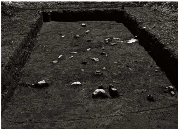
S I 12確認状況 (1) サブトレンチ掘削前 (北から)