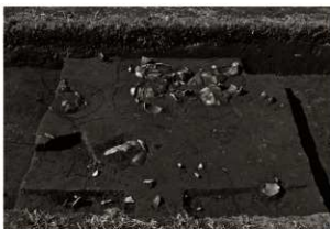
S K 59 ~ 61確認状況 (1) (南から)