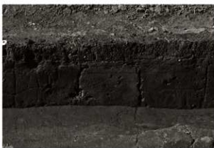
S I14セクション (2) 東部 (南から)