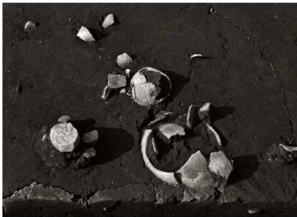
SK81遺物出土状況（南から）