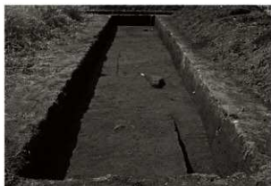
第14トレンチ全景 (東から)