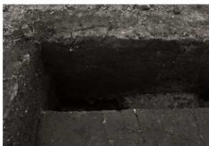
S K 65セクション (東から)