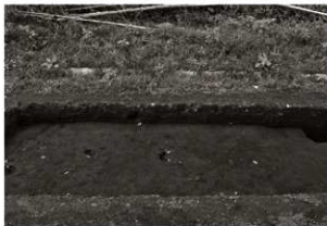
S I 12確認状況 (2) (東から)