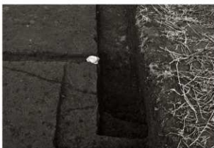
S I 17 柱穴確認状況 (西から)