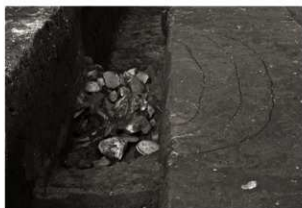
S K58調査状況 (2) サブトレンチ掘削後 (南から)