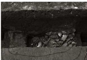
S K58遺物出土状況 (1) (東から)