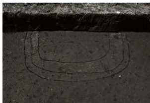
S K58確認状況 (東から)