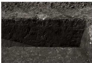
S I 15セクション (南から)