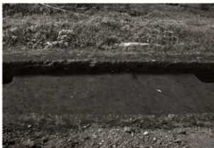
S I 11確認状況 (2) (東から)