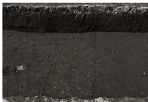
S D 7 確認状況 (南から)