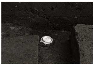
S I 17No.1 出土状況 (北から)