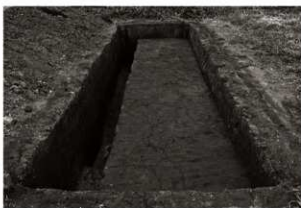
第13トレンチ1・2区全景 (南から)