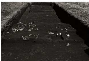
S K 59 ~ 61確認状況 (3) (西から)