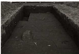
S I 15竈確認状況 (西から, 手前はS I 14)