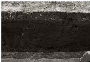
SK96セクション (東から)