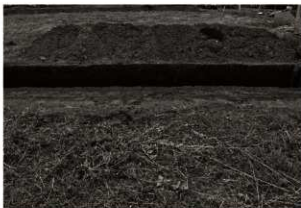
第13トレンチセクション (1) 1・2区 (東から)