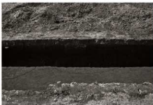
第13トレンチセクション (3) 6区 (東から)