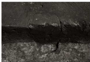
SB1P3セクション (西から)