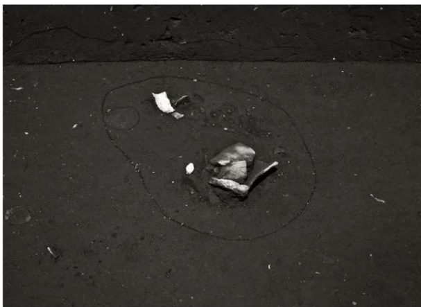
S K 67竈確認状況 (1) (南から)