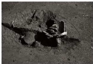
S K67調査状況 (2) (南から)