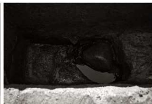
S K 65確認状況 (東から)