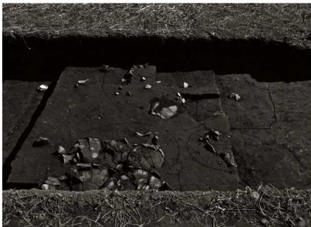
S K 59 ~ 61確認状況 (2) (北から, 手前右 S K 59, 手前左 S K 60, 奥 S K 61)