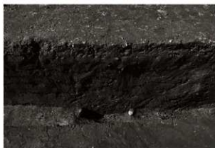
SK94・95確認状況 (東から)