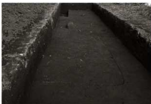
S I14確認状況 (西から)