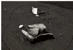
S K67確認状況 (2) 拡大 (南東から)