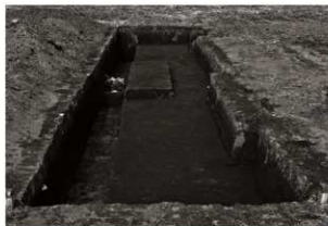
第13トレンチ5・6区全景 (南から)