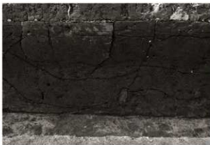
SK71セクション (2) 北部 (東から)