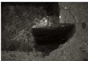
SB1P2セクション (東から)