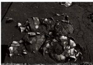
S K 60確認状況 (北から)