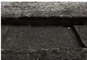
S I 17・18 確認状況 (北から)