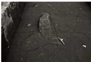
S I 14竈確認状況 (西から)