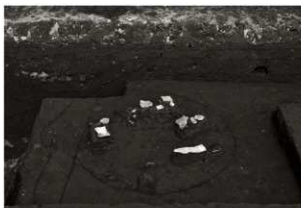
S K 83確認状況 (2) (南から)