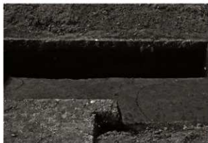
第13トレンチセクション (2) 5区 (東から)