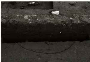
SK81セクション（南から）