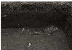
S I 15竈確認状況 (西から)