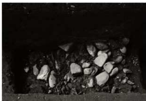
S K 58調査状況 (3) 遺物採取後 (東から)