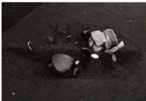
S K67調査状況 (1) (南から)