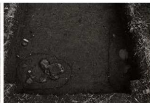
S K 25・26確認状況 (3) (西から)