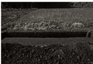
第11トレンチ11・12区セクション（東から）