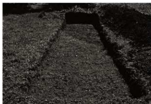
第7トレンチ全景 (1) サブトレンチ掘削前 (北から)