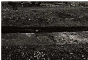
第16トレンチセクション (1) 西端付近 (南から)