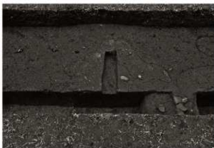
S I 8 確認状況（1）（西から）