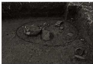
S K 25確認状況（1）（東から）