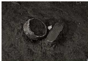
第8トレンチNo75・85出土状況（南から）