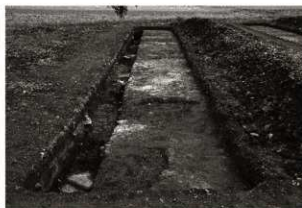
第16トレンチ全景 (西から)