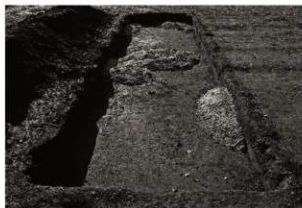
第8トレンチ保護措置状況（東から）