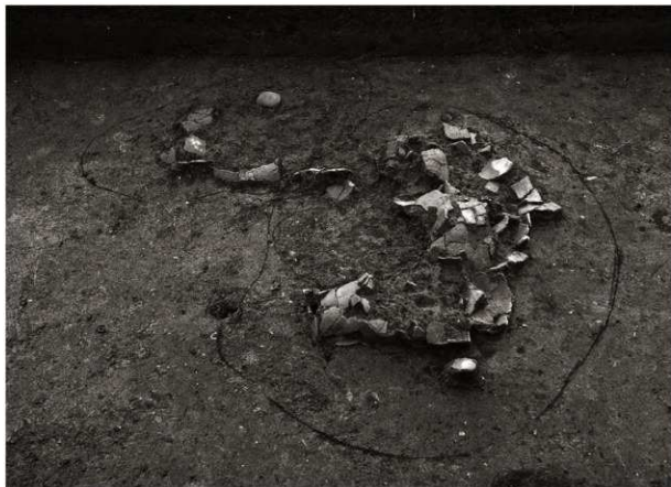
S K 24・30確認状況（北から）