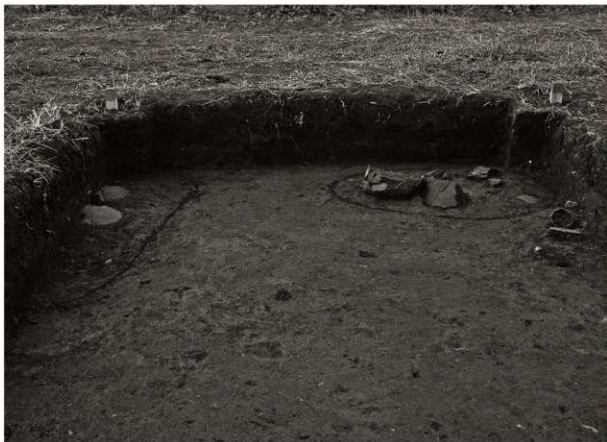
S K 25・26確認状況 (1) (東から)