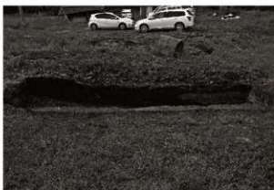
第7トレンチセクション (1) (東から)