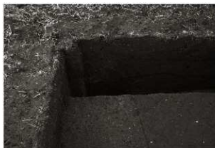
SD 2 セクション（東から）