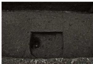
S K 18確認状況 (東から)