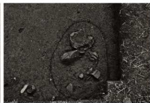
S K 25確認状況（2）（鉛直、上が南）