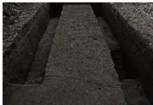
SD 1・2 確認状況（北から）