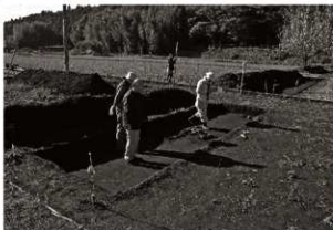
作業風景 (7) 遺構確認 (第8トレンチ)