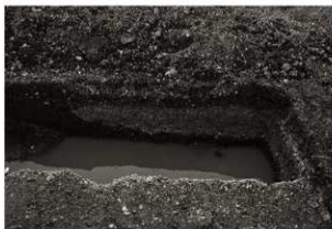
第7トレンチセクション(4) 北端付近(東から)