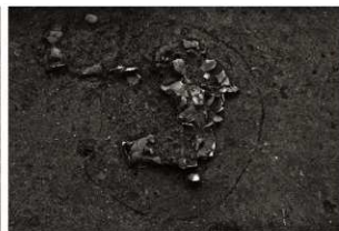
S K 24確認状況（北から）