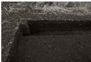
第11トレンチ3・4区セクション（2）南端付近（東から）