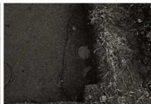
S K 26確認状況 (2) (鉛直, 上が東)