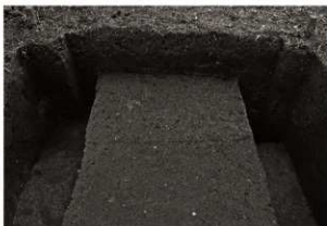
SD 2 確認状況（北から）