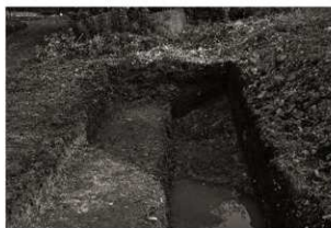
第7トレンチ南端部拡大 (北から)