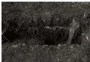
第16トレンチセクション (3) 東端拡大 (南から)