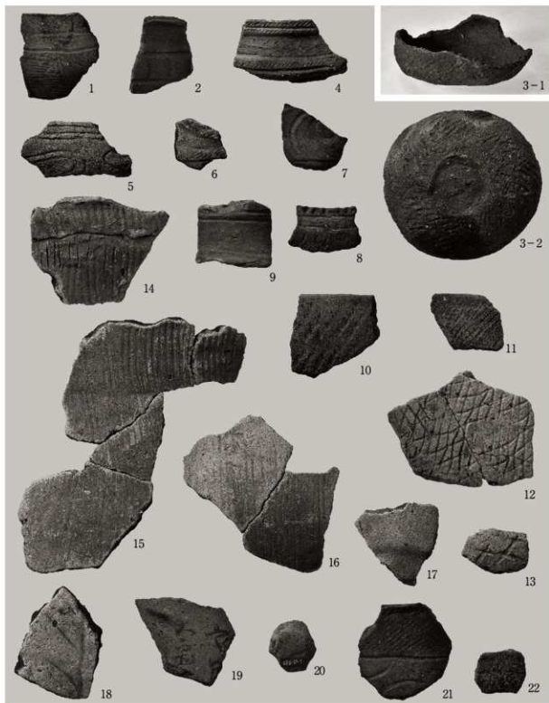
第2トレンチ出土遺物(1)