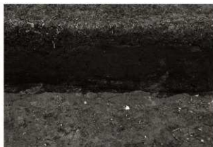
S14セクション（南から）