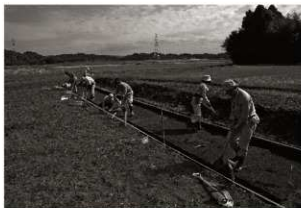
作業風景 (4) サブトレンチ掘削 (第9トレンチ)