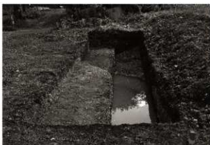
第7トレンチ全景 (2) (北から)