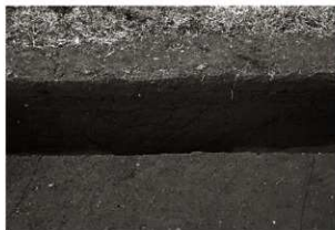
SD 1 セクション（東から）