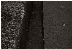
SK15・SK45・SX5 確認状況 (南から)