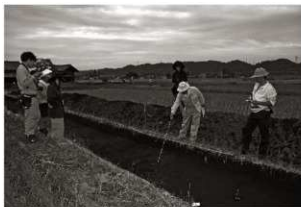
作業風景 (8) 遺構確認 (第3トレンチ)