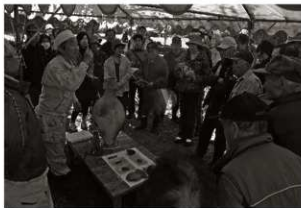
現地説明会 (2) 出土遺物解説