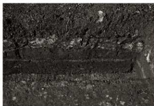
S15セクション（南から）