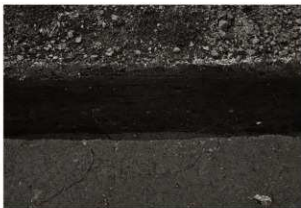
SK45 確認状況 (東から)