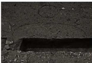
S K 31 確認状況（西から）