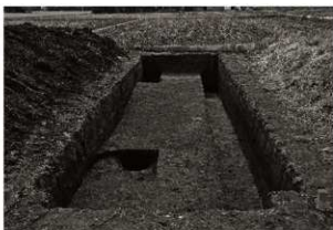
第11トレンチ11・12区全景（1）（北から）