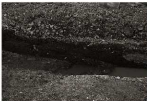
第7トレンチセクション(3) 中央付近(東から)