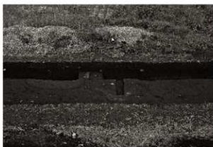
S I 8、S K 31 確認状況（東から）