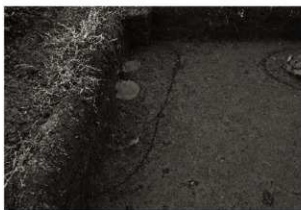
S K 26確認状況 (1) (東から)