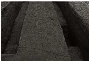
SD 1 確認状況（北から）