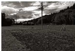
作業風景 (1) トレンチ設定