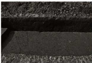
SK46～48 確認状況 (東から)