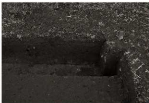
第11トレンチ3・4区セクション（1）北端付近（東から）