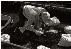
作業風景 (6) SK24検出 (第8トレンチ)