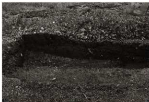
第7トレンチセクション(2) 南端付近(東から)