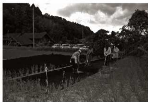
作業風景 (3) 表土除去 (第6トレンチ)