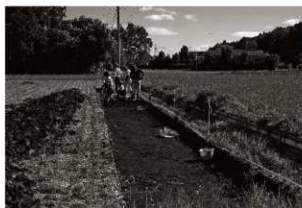
作業風景 (2) 表土除去 (第3トレンチ)