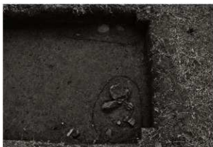
S K 25・26確認状況 (2) (北から)