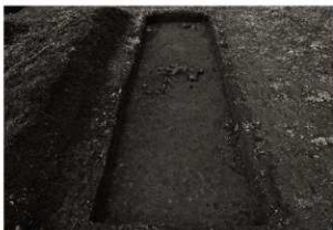
第8トレンチ全景(東から)