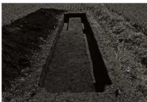
第11トレンチ7・8区全景（北から）