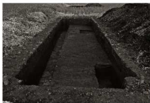
第11トレンチ11・12区全景（2）（南から）