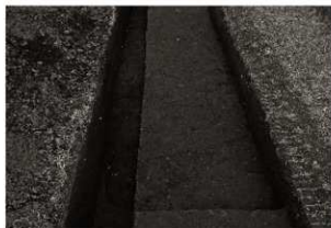
SK45～48・SX5 確認状況 (南から)