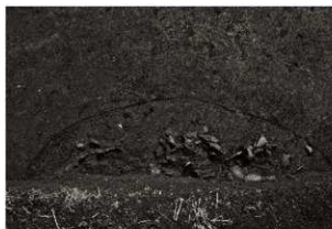
S K 23確認状況（2）（鉛直、上が南）