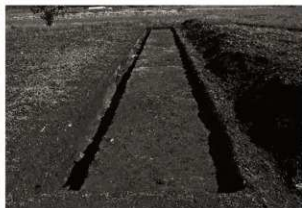
第9トレンチ全景（西から）