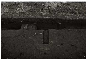
S I 8 確認状況（2）（東から）