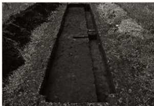
第11トレンチ3・4区全景（北から）