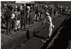
現地説明会 (1) 遺構の解説