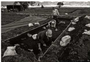
作業風景 (5) 遺構検出 (第8トレンチ)