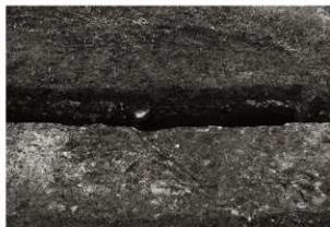
第16トレンチセクション (2) 東端付近 (南から)