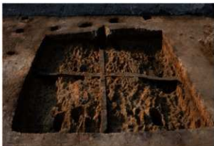
第76号住居跡掘方完掘状況(南東方向から)