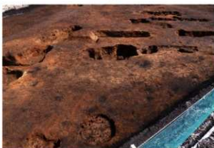
第1調査区土坑群完掘状況④(南方向から)