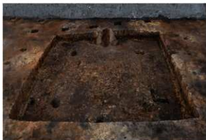
第76号住居跡完掘状況(南東方向から)