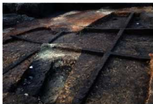
第85・86号住居跡埋没状況(南東方向から)