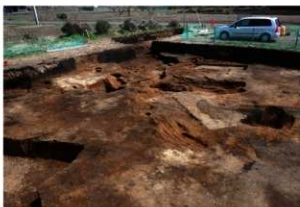
第3調査区攪乱部(北西方向から)