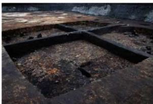
第76号住居跡埋没状況(南東方向から)