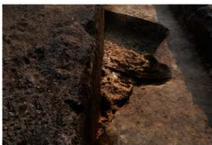
第93号住居跡掘方完掘状況(東方向から)