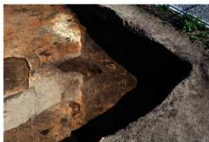
第84号住居跡完掘状況(北西方向から)