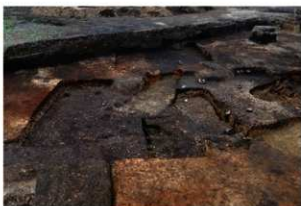
第81～83・85・86・97号住居跡遺物出土状況(南方向から)