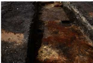
第91・100号住居跡完掘状況((東方向から)