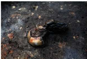
第97号住居跡遺物出土状況(南東方向から)