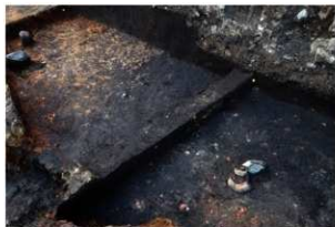
第97号住居跡遺物出土状況(南東方向から)