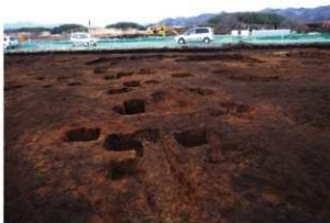
第1調査区土坑群完掘状況③(南方向から)