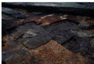
第85・86号住居跡遺物出土状況(南東方向から)