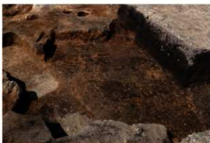
第89号住居跡完掘状況(南方向から)