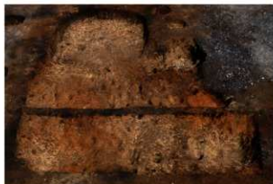
第68号住居跡掘方完掘状況(南東方向から)