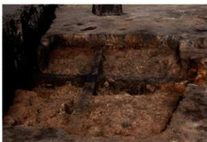
第82号住居跡掘方完掘状況(南西方向から)