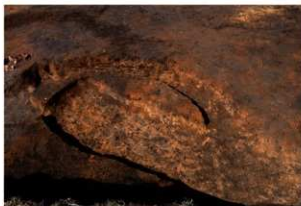
第1号性格不明遺構完掘状況(南方向から)