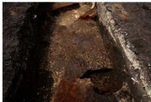
第91号住居跡完掘状況((東方向から)