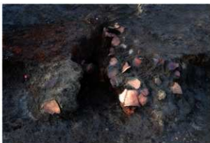
第81号住居跡竈遺物出土状況(南方向から)