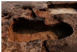
第1号地下式坑完掘状況(北方向から)