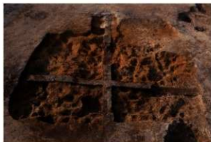
第69号住居跡掘方完掘状況(南東方向から)