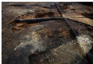
第3調査区攪乱部(南方向から)