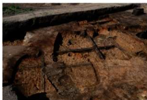
第81～83・85・86・97号住居跡掘方完掘状況(南方向から)