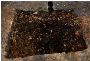
第72号住居跡完掘状況(南方向から)