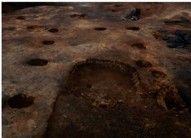
SB1 完掘状況(南東方向から)