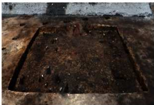
第76号住居跡遺物出土状況(南東方向から)