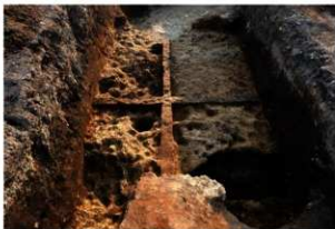
第91号住居跡掘方完掘状況(東方向から)