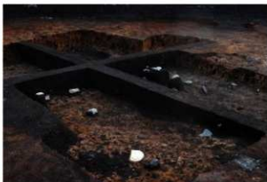
第77号住居跡埋没状況(北方向から)