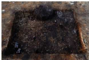
第67号住居跡遺物出土状況(南方向から)