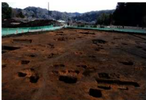
第1調査区土坑群完掘状況①(西方向から)