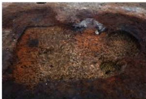
第74号住居跡完掘状況(南方向から)