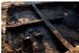
第92号住居跡埋没状況(南東方向から)