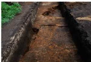
第93・94・96号住居跡完掘状況(西方向から)