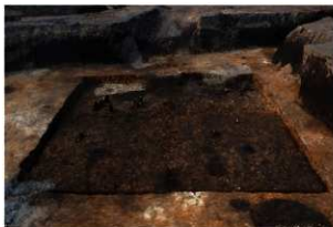
第70号住居跡遺物出土状況(南方向から)