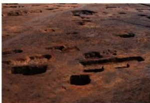
第1調査区土坑群完掘状況⑥(北西方向から)