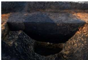
SK20-22-35埋没状況(南方向から)