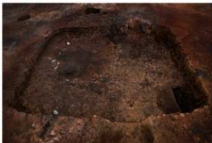
第77号住居跡完掘状況(西方向から)