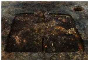
第75号住居跡完掘状況(南方向から)