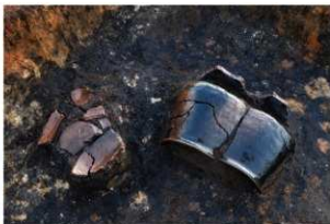
第67号住居跡遺物出土状況(東方向から)