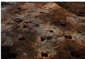
SB3・4 完掘状況(西方向から)