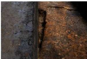
第96号住居跡完掘状況(南西方向から)