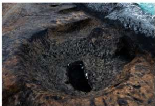
SK20-22-35完掘状況(南東方向から)