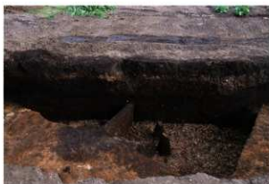
第93号住居跡埋没状況(北西方向から)