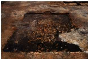
第71号住居跡完掘状況(南東方向から)