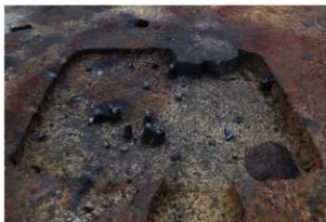
第77号住居跡遺物出土状況(西方向から)