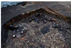
第76号住居跡遺物出土状況(南西方向から)