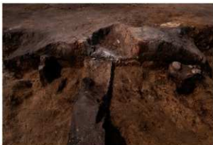
第70号住居跡竈袖部断ち割り状況(南方向から)