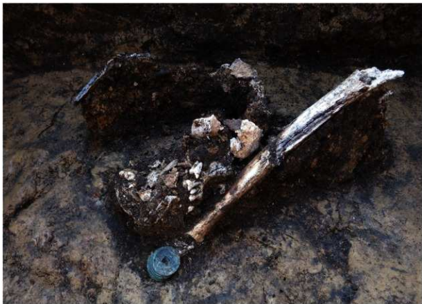
第2号墓塚遺物出土状況(東方向から)