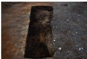
第73号住居跡完掘状況(南東方向から)