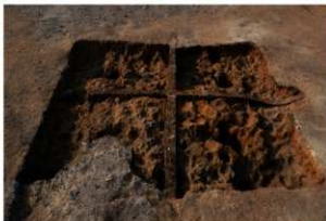
第71号住居跡掘方完掘状況(南東方向から)