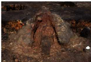
第76号住居跡竈完掘状況(南東方向から)