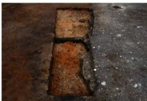
第73号住居跡掘方完掘状況(南東方向から)