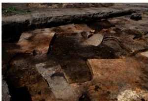
第81～83号住居跡完掘状況(南方向から)