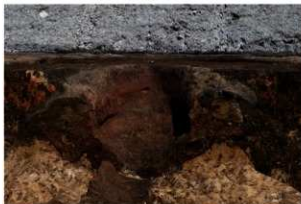
第76号住居跡竈袖部断ち割り状況(南東方向から)