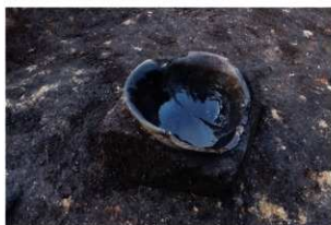
第83号住居跡遺物出土状況(南方向から)