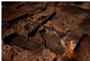
第83号住居跡掘方完掘状況(北東方向から)