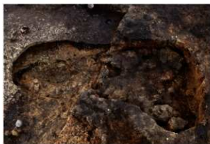
第1号地下式坑天井土崩落状況(南方向から)