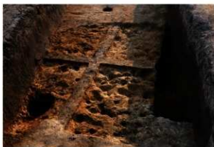
第94・96号住居跡掘方完掘状況(北東方向から)