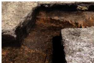
第90号住居跡完掘状況(南西方向から)