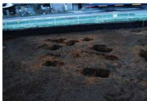
第1調査区土坑群完掘状況⑤(東方向から)