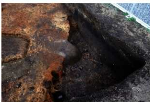
第84号住居跡遺物出土状況(西方向から)