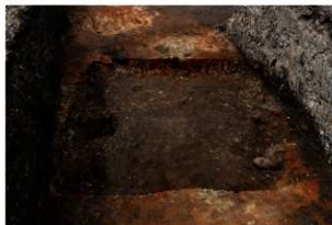
第92号住居跡完掘状況(東方向から)