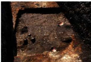
第92号住居跡遺物出土状況((東方向から)