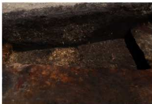
第95号住居跡完掘状況(南方向から)