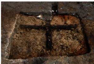
第72号住居跡掘方完掘状況(南方向から)