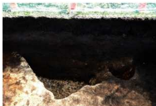
第79号住居跡完掘状況(北方向から)