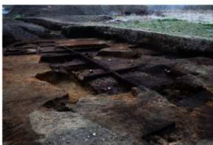
第81～83・85・86・97号住居跡埋没状況(東方向から)