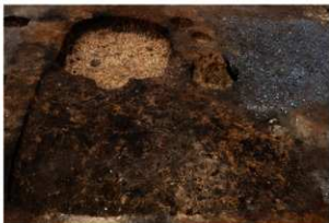
第68号住居跡・SK260完掘状況(南東方向から)