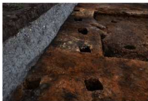
SB2 完掘状況(西方向から)