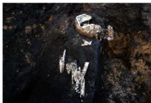
第1号墓壙遺物出土状況(西方向から)