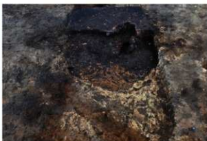
第78号住居跡竈完掘状況(西方向から)