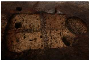
第74号住居跡掘方完掘状況(南方向から)