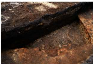
第93号住居跡完掘状況(北東方向から)