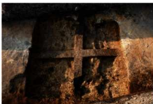
第92号住居跡掘方完掘状況(北方向から)