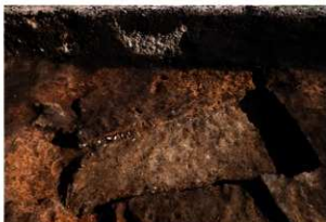
第87号住居跡完掘状況(北西方向から)