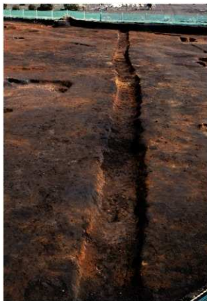
SD2完掘状況(西方向から)