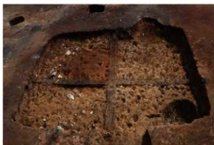
第77号住居跡掘方完掘状況(西方向から)