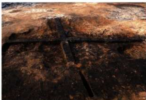
第69号住居跡埋没状況(南方向から)