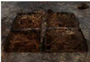
第75号住居跡掘方完掘状況(南方向から)