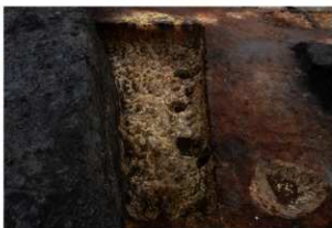
第95号住居跡掘方完掘状況(西方向から)