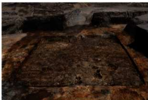
第70号住居跡完掘状況(南方向から)