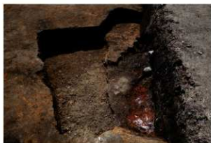
第88号住居跡完掘状況((北東方向から)