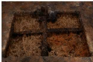
第67号住居跡掘方完掘状況(南方向から)