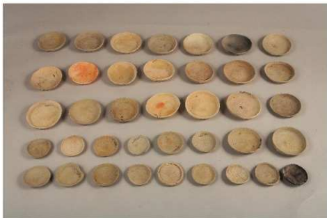
かわらけ (12世紀後半)