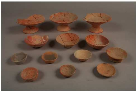
かわらけ (12世紀前半)