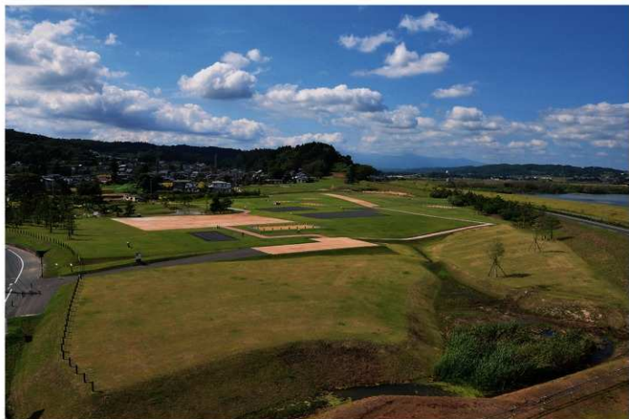
柳之御所遺跡全景