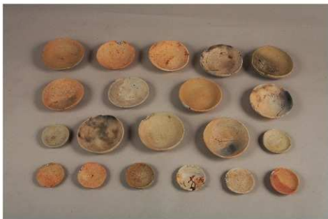
かわらけ (12世紀中葉)