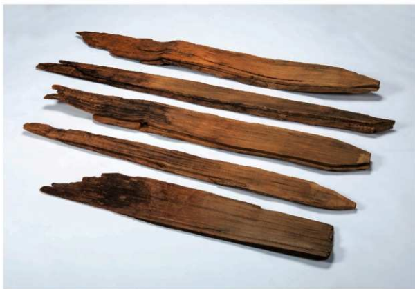
第1号井戸跡 井戸外枠(縦板)