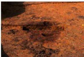
第3号竪穴建物跡カマド火床面 土層断面 南から