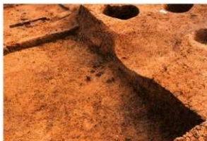
4区 縄文土器出土 北から