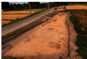
3区 III層調査終了 南から