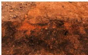
第1号竖穴建物跡 焼土検出 南から