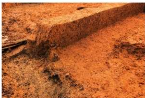
4区 縄文土器出土 北から