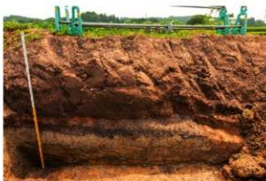
4区 基本土層断面 西から