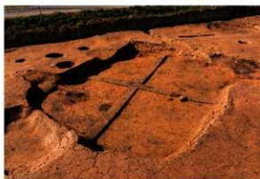
第3号竪穴建物跡掘方 南東から