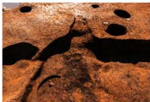
第3号竪穴建物跡カマド 完掘 東から