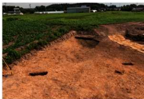
4区 東側IIIa層調査終了 北から