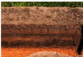
1区 基本土層断面 (IV H-16 付近) 西から