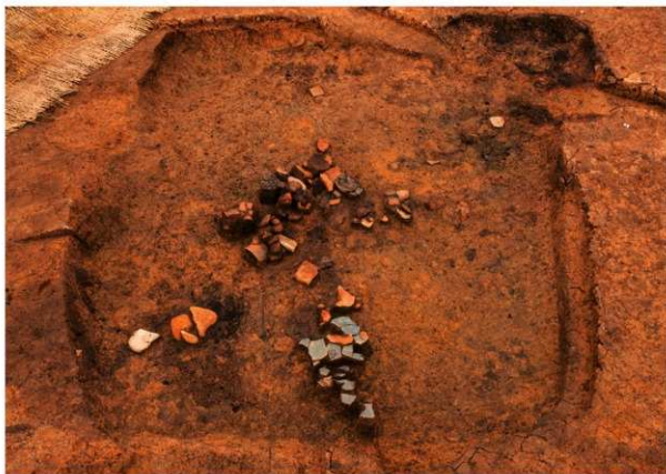
第3号竪穴建物跡 遺物出土（土層観察用畦部分）南から