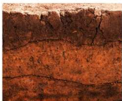
1区 縄文土器出土地点土層断面 西から