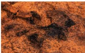
第1号竖穴建物跡 炭化物検出 南から