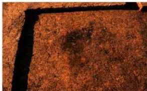
第2号竖穴建物跡 被熱範囲検出 南から