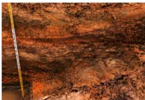
4区 基本土層断面 東から