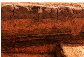
1区 基本土層断面 (IV J-14 付近) 西から