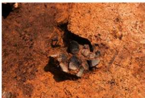
4区 縄文土器出土 北から