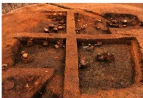
第3号竪穴建物跡 遺物出土 南から