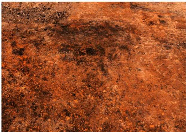
第1号竖穴建物跡 検出 南から