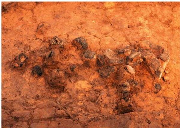
1区 縄文土器出土 西から