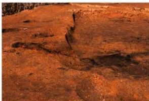
第3号竪穴建物跡カマド 土層断面 南から