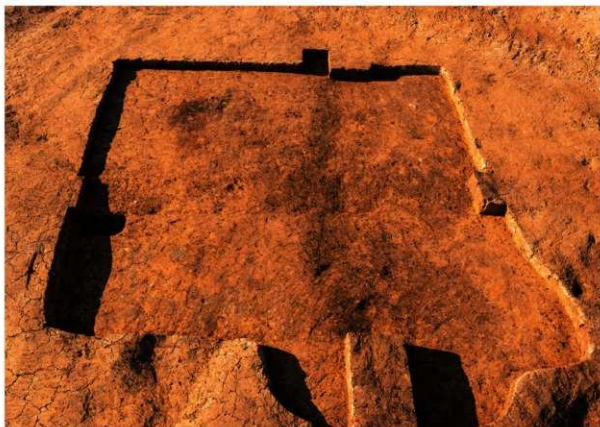
第2号竖穴建物跡 完掘 南から