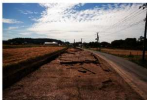
1区 III層調査終了 南から