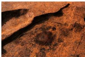
第3号竪穴建物跡カマド火床面 検出 北東から