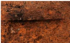
第2号竖穴建物跡 被熱範囲断面 西から