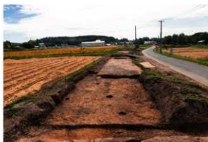
2区 III層調査終了 北から