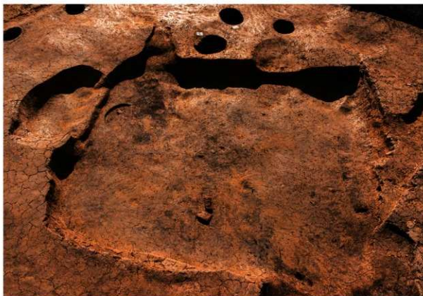
第3号竪穴建物跡 完掘 東から