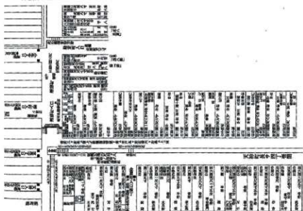
第8図 「天神町絵図」【2】文政6(1823)年 白河市歴史民俗資料館蔵2003より抜粋