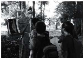
第6図 (伝) 金売吉次の墓での職員の説明

て、検討を行うなどの課題に取り組んだ。また、(伝)金売吉次の墓では、墓の由来などについて、吉次に扮した職員から説明を受けた(第5・6図)。