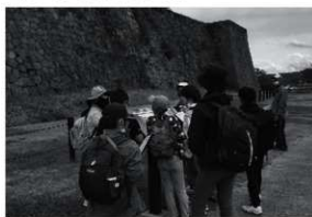
第14図 小峰城曲輪の見学