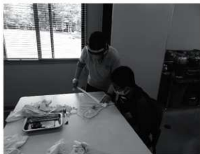
第2図 布ぞりづくり 指導の様子

活動時間については、感染症の拡大状況と活動内容を鑑みながら決定した。感染症拡大前は午前10時から午後3時までの5時間(正午から1時間は昼休憩)だった。しかし感染症拡大が始まってからの2年間は、館内での飲食は原則禁止としていた