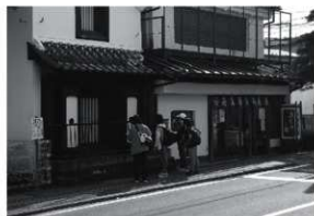
第10図 歴史的建造物見学