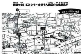
第3図 第3回活動で使用した地図

フィールドワークでは、ワークシートに基づき課題に取り組んだ。石阿弥陀の一里塚では、一里塚に上り大きさや形を体感し、一里塚間の距離を計測するなどした。鍛冶屋敷館跡では、土塁が残り、現在は中世の館跡と推定される一方で、関ヶ原の戦いに関連した上杉方の防塁跡とする説も提示されている。塾生は鍛冶屋敷館跡の性格やその背景について