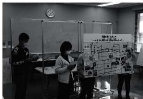
第17図 発表会のようす