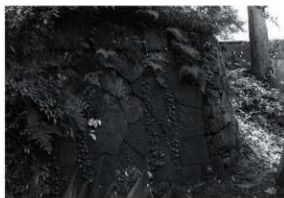
第13図 小峰城外掘土壘跡