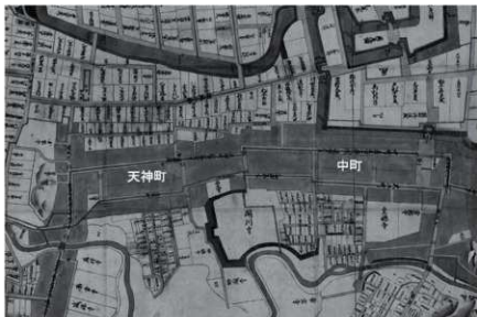
第7図 『奥州白河城下全図』 白河市指定重要文化財 白河市歴史民俗資料館所蔵 一部抜粋・加工