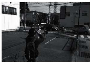
第11図 市内に残る魚形の道路