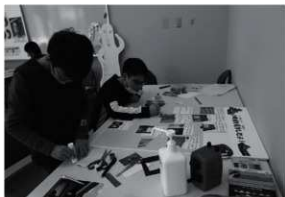
第16図 文化財マップづくり