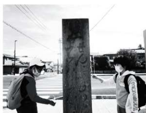
第12図 道標(復元)の観察