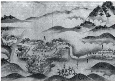
第4図 江戸時代の白河宿周辺の奥州街道の様子 『江戸より奥州津軽迄道筋之圖』江戸時代後期 国立国会図書館デジタルコレクション所蔵より抜粋・一部加工