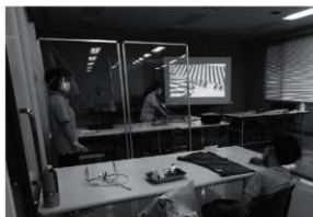
第1図 布ぞりづくり 作り方の解説