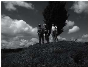
第5図 石阿弥陀の一里塚