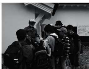
第15図 施設ボランティアによる解説

える人々との交流によって、文化財により親しみを感ずることができる教育的な効果も期待できると感じた。