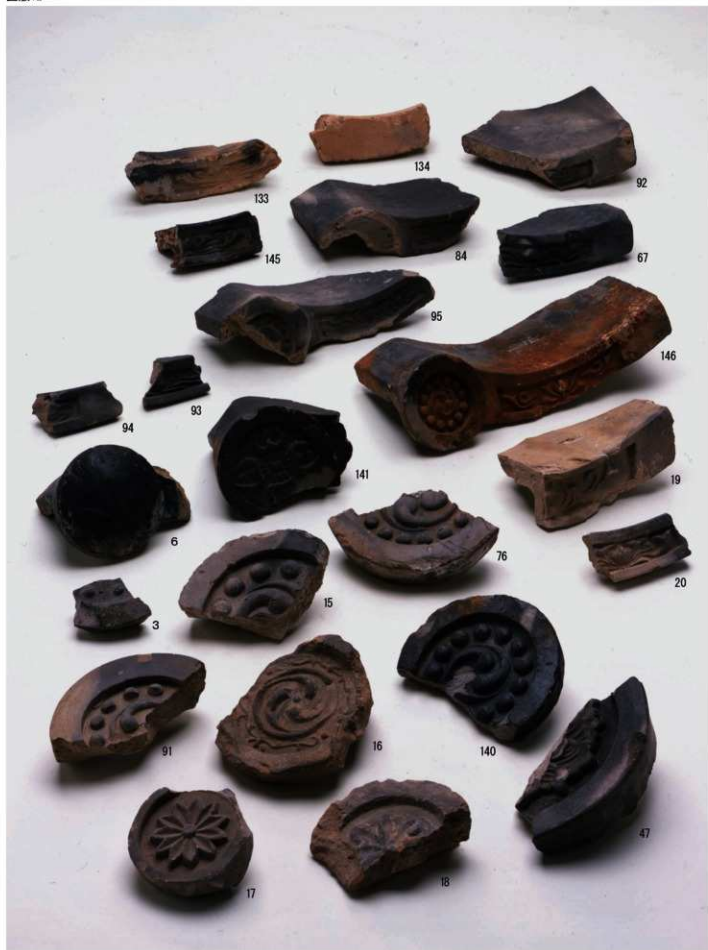
軒丸瓦・軒平瓦・軒棧瓦・小菊瓦