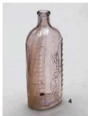
鬼瓦・土器・鉄製品・ガラス製品・石製品・木製品