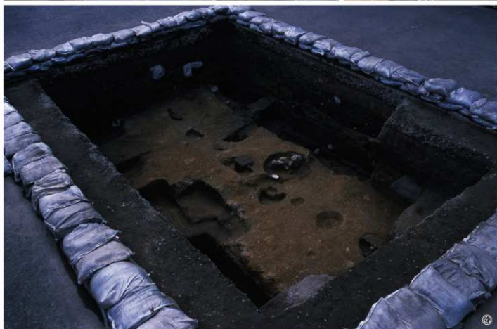
①上から見た本丸大奥跡T(南から) ②本丸大奥跡T土坑2完掘状況(北から) ③本丸大奥跡T排水溝(北から) ④本丸大奥跡T完掘状況(西から)