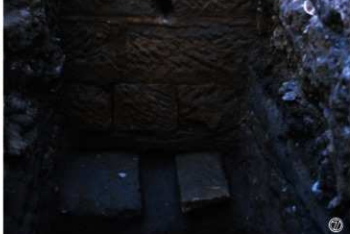
①琉球館跡T完掘状況（北西から） ②琉球館跡T溝状遺構半截状況（北西から） ③琉球館跡T土坑・杭半截状況 ④琉球館跡T遺物出土状況 ⑤吉野館跡T調査区全景（北西から） ⑥吉野館跡T西壁土層断面（東から） ⑦吉野館跡T石垣検出状況（北から）