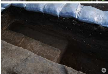
①上から見た61T ②61T 石列遺構検出状況 ③61T 石列遺構検出状況 ④62T 土坑半載状況 ⑤空から見た62T ⑥62T 遺構検出状況