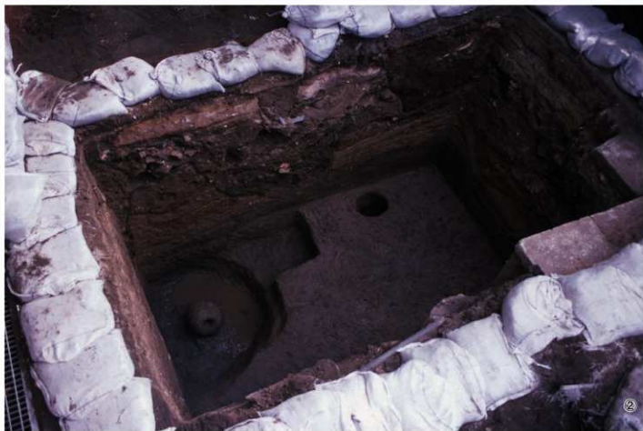
①唐御門跡T礎石検出状況（西から） ②琉球館跡完掘状況（北西から）