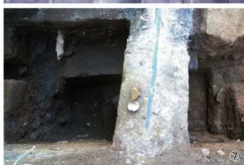
①上から見た63T ②63T 完掘状況 ③63T 完掘状況 ④63Tヒューム管検出状況 ⑤64T 遺構検出状況 ⑥64T 掘削状況 ⑦64T 遺構検出状況