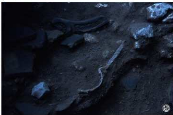
①大手口跡3T完掘状況 ②大手口跡3T布地棄核出状況 ③大手口跡3T鬼瓦核出状況 ④大手口跡3T北壁土層断面 ⑤大手口跡3T瓦核出状況（北から）