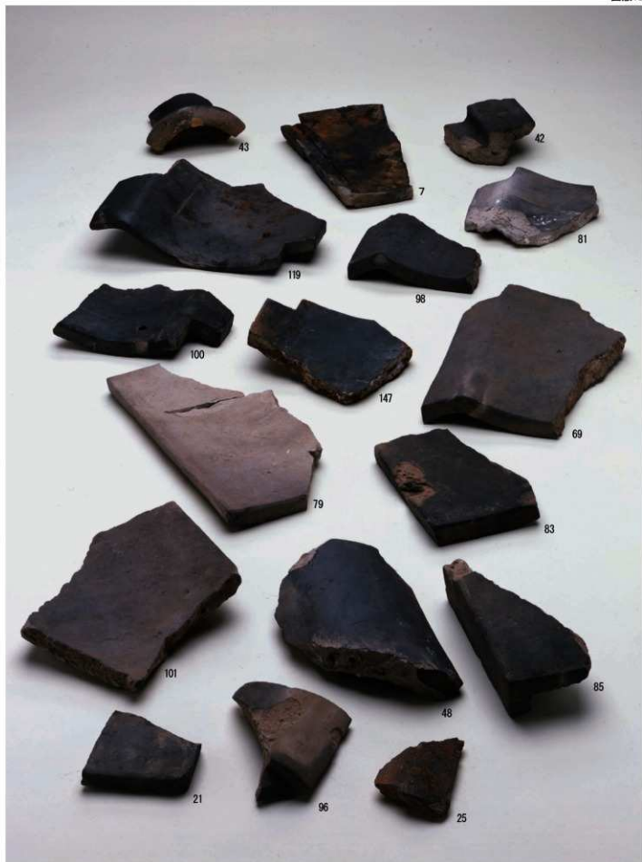
丸瓦・平瓦・横瓦・伏間瓦