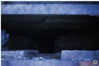
①南泉院跡T調査終了状況(南西から) ②南泉院跡T全景(南東から) ③南泉院跡Tピット完掘状況(南から) ④南泉院跡T東壁土層断面(西から) ⑤唐御門跡T完掘状況(北から) ⑥唐御門跡T方形土坑検出状況(南から) ⑦唐御門跡T東壁土層・鑄鉄管検出状況