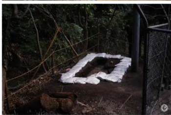
①大手口跡調査区全景 ②大手口跡1T 完掘状況 ③大手口跡1T 礎石検出状況(南から) ④大手口跡1T 完掘状況(南から) ⑤大手口跡3T全景(南から) ⑥大手口跡1T全景(南から) ⑦大手口跡5T完掘状況(南西から)