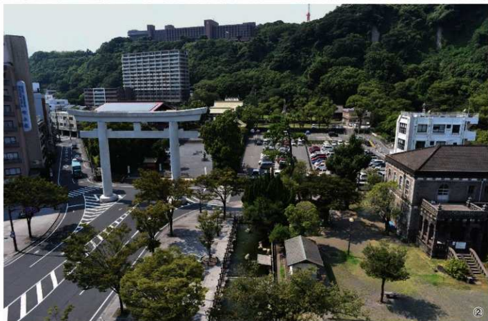
①59～63T・本丸南堀調査区全景 ②64T・大手口跡・南泉院跡調査区全景