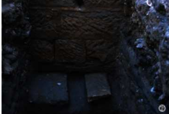
①琉球館跡T完掘状況（北西から） ②琉球館跡T溝状遺構半截状況（北西から） ③琉球館跡T土坑・杭半截状況 ④琉球館跡T遺物出土状況 ⑤吉野堀跡T調査区全景（北西から） ⑥吉野堀跡T西壁土層断面（東から） ⑦吉野堀跡T石垣検出状況（北から）