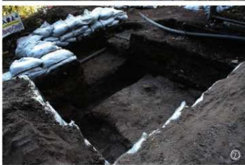
①大手口跡調査区全景 ②大手口跡1T 完掘状況 ③大手口跡1T 礎石検出状況(南から) ④大手口跡1T 完掘状況(南から) ⑤大手口跡3T 全景(南から) ⑥大手口跡1T 全景(南から) ⑦大手口跡5T 完掘状況(南西から)