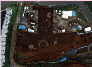
▲子易・中川原遺跡 4-1②・5c 工区 縄文時代後期集落 (南から)