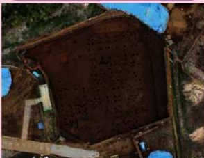
▲子易・中川原遺跡 6-1 工区 中世掘立柱建物群 (屋敷跡) (南から)