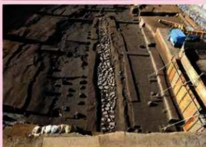
▲子易・中川原遺跡 3d 工区 中世石敷溝状遺構 (東から)