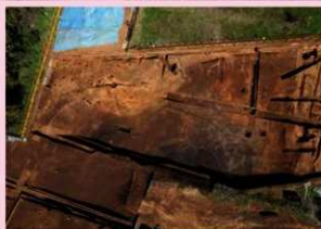
▲子易・中川原遺跡 2 工区 中世池状遺構 (南から)