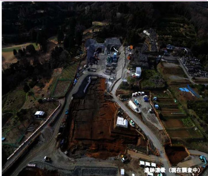
遺跡遺景 (現在調査中)

伊勢原市子易地区に所在する子易・中川原遺跡は、新東名高速道路建設に伴い平成24年度から調査を継続しています。現在は3e工区+2工区残地から4-1④工区+5a工区にまたがる縄文時代～中世の埋もれた谷と縄文後期の集落（住居跡）などを調査しています。この谷地形は、縄文時代には周辺集落の水場として利用された可能性があり、弥生時代の河道も発見されています。中世には、埋もれた谷の上面に石を敷いた道路跡が見つかっており、近世には畑地・水田となっています。このように、各時代にわたって谷地形を利用してきた様子が分かってきました。