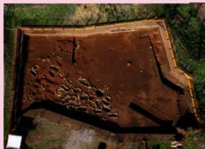
▲子易・中川原遺跡 4-2 工区東 縄文時代後期土坑墓・配石墓群 (南から)