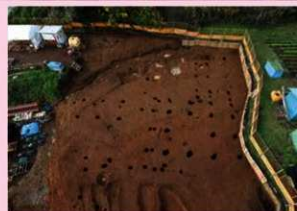
▲子易・中川原遺跡 4-1①工区 中世掘立柱建物群 (東から)