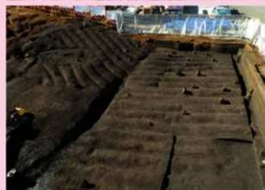
▲子易・中川原遺跡 3c 工区 奈良・平安時代畝状遺構 (東から)