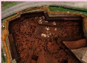
▲子易・中川原遺跡 4-2 工区西 縄文時代後期集落 (北西から)