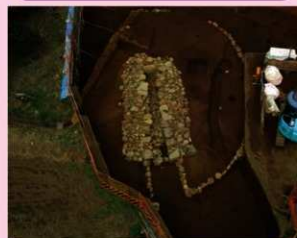
▲子易・中川原遺跡 4-1④・5d 工区 2号墳 (円墳) (南東から)