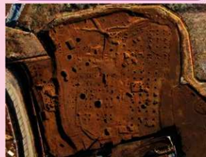
▲子易・中川原遺跡 6-2・6-3 工区 中世掘立柱建物群 (屋敷跡) (南から)