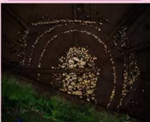
▲子易・中川原遺跡 6-3 工区 1号墳 (方墳) (南東から)