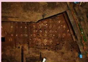
▲子易・中川原遺跡 1-1・1-2 工区 中世礎石建物群 (寺院跡) (東から)