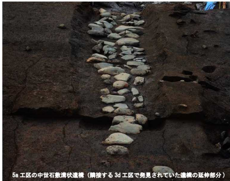
5a工区の中世石敷溝状遺構（隣接する3d工区で発見されていた遺構の延伸部分）