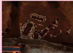
▲子易・中川原遺跡 4-1③工区 縄文時代後期配石墓群 (西から)