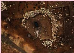
▲子易・中川原遺跡 4-1②工区 縄文時代後期敷石住居跡 (南東から)