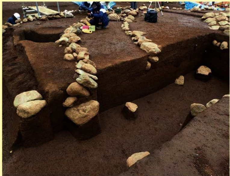
墳丘断面の様子（南から）