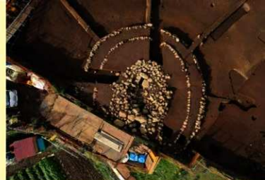
方形石積除去後の1号墳（上から）