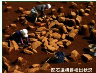
配石遺構群検出状況