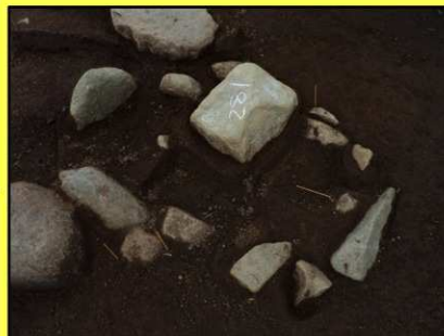
楕円形に並ぶ配石遺構