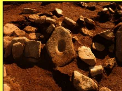
凹穴を有する立石状の配石遺構