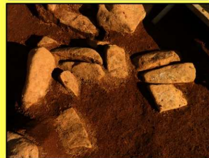
組石状の配石遺構