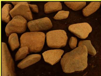
方形に並ぶ配石遺構

配石遺構群全体を見るとブロック状に石が集まっている箇所があり、北西から東南方向に向かって石が列をなしているようにも見受けられます。この方角に何の意味があるかは分かりませんが、縄文人にとっては重要な意義があったのかもかもしれません。