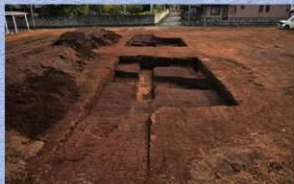
調査区全景（北から）