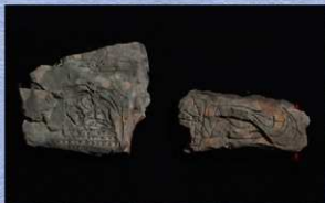
2個体出土した線刻のある石