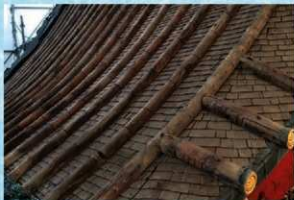
こけら葺きの旧屋根下地（屋根北面・北西から）

また、享保7年（1722）と書かれた墨書が新たに見つかり（右写真参照）、本殿の建築年代と実際に携わった職人の名前が判明しました。