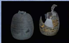
出土例の少ない平底短頸瓶（須恵器）