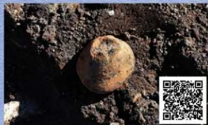
出土した土鈴 ※QRコードで遺跡・遺物紹介動画ページへ