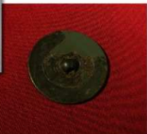
小型倭製鏡(こがたわせいきょう)

これらの遺物のほとんどが、竪穴建物の床面ではなく、埋もれていく途中の土の中から出土したものです。廃棄され埋没していく建物跡で祭祀を行っていた可能性があります。