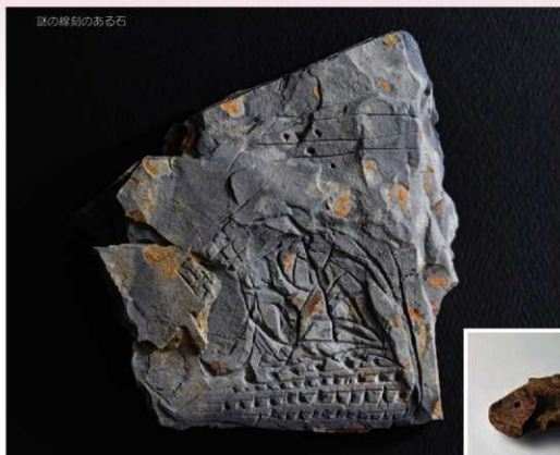
謎の線刻のある石

太田市北東部に位置する吉沢町。古墳時代、この地に巨大な集落がつけられました。小字から名をとって「反丸遺跡」と呼ばれる遺跡です。