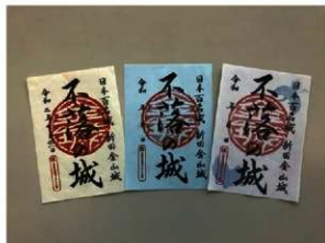
オリジナルグッズ（新田金山城御城印）

当施設では、新田金山城御城印のほか金山城に関連するオリジナルグッズを有償頒布しております。来館・登城記念に大好評です。(オリジナルグッズは郵送対応しておりません。直接ご来館の上購入してください。)