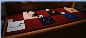
水晶製勾玉などの希少な石製品