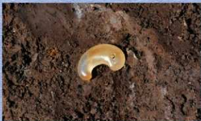
竪穴建物跡の覆土から出土した瑪瑙製勾玉