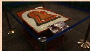
二ツ山古墳1号墳(新田天良町)の模型