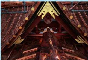
修復後の千鳥破風屋根（屋根南面・南から）

修理方針として、これまでの修理履歴を尊重して、現在の形状、材料をできるだけ保存することとしたため、屋根の解体調査を行いました。