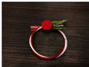
水引でつくった正月用のリース