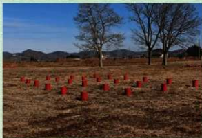
上野国新田郡家跡 正倉跡の柱表示

現地では、調査で見つかった建物の位置や規模がわかるように柱位置に赤い小型ドラム缶を置いて表示しています。