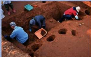
溝を調査している様子（南東から）

調査区西側で確認された溝は、断面が急峻斜なV字形の業研堀となつています。近隣の調査でも同様の溝が確認されており、それらを経ぶると方形の区画となることが分かりました。そのため、この溝は館の堀として掘削されたと想定されます。溝の東側には並走するように、柱穴列2条が確認されました。