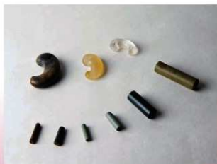
勾玉と管玉(くだたま)

これらの遺物のほとんどが、竪穴建物の床面ではなく、埋もれていく途中の土の中から出土したものです。廃棄され埋没していく建物跡で祭祀を行っていた可能性があります。