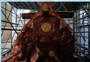
復元した大屋根鬼板飾り（屋根東面・東から）