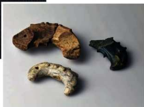
子持勾玉(こもちまがたま)

その結果、古墳時代の竪穴建物(住居)跡400軒以上、収納箱で900箱を超える遺物が見つかり、一つの巨大集落の様子が明らかになりました。