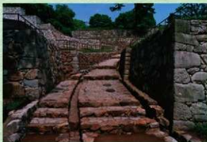
金山城跡の大手虎口

一方、金山城跡整備箇所を中心に活動しているボランティア組織の「金山城保存会」や「金山の松と竹を愛する会」の協力を得て、除草や竹林整理などの環境整備に取り組みました。