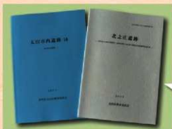
令和2年度に刊行した報告書

令和2年度には、令和元年度の各種開発に伴う確認調査をまとめた『太田市内遺跡16』と平成21・28年度に太田市立宝泉小学校敷地内で実施した発掘調査結果をまとめた『北之庄遺跡』を刊行しました。