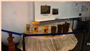
円筒埴輪用の展示台