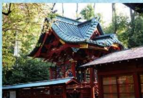
修復前の冠稲荷神社本殿（南西から）

現在の屋根に葺き替えられた時期は不明ですが、経年による劣化が進んでおり、雨漏りも発生していたため、修復前と同様に銅板葺き屋根の葺き替えを行いました。