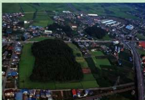
南上空からみた天神山古墳・女体山古墳

古墳時代中期（5世紀前半）の巨大古墳である史跡天神山古墳（太市内ヶ島町）では、除草などの環境整備を行いました。