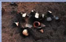
溝から出土した土器・炭化物（北から）

分譲住宅建設に伴い発掘調査を実施しました。その結果、古墳時代の溝が1条確認されました。溝は東西方向に延びており、古墳時代前期後半から中期頃の土師器のほか、炭化物がまとめて出土しました。