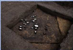
3号竪穴建物跡出土遺物（南西から）