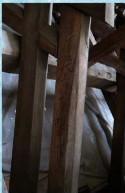
享保7年（1722）に書かれた墨書