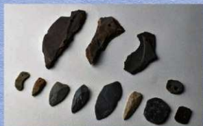
祭りの道具である石製模造品