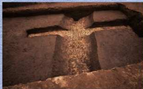
古墳時代の溝（西から）