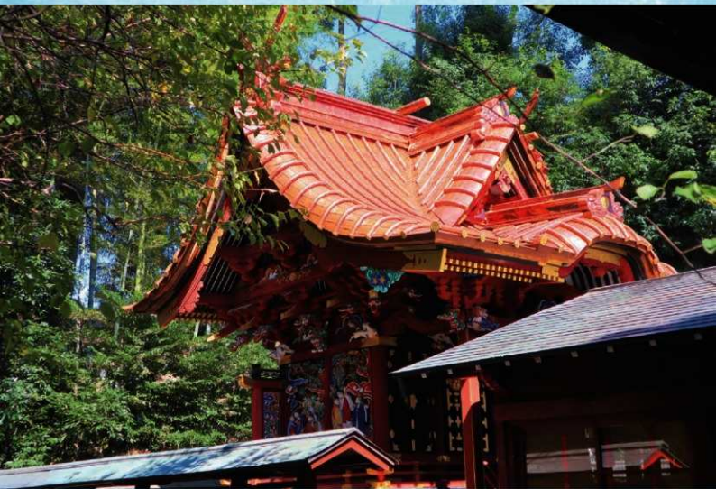
修復後の冠稲荷神社本殿（南西から）

前回の屋根修理から数十年が経過し、腐朽が進んでいたため、令和2年4月8日から令和2年9月30日までの約6か月間をかけ、所有者の冠稲荷神社による「冠稲荷神社本殿屋根保存修理工事」が実施されました。