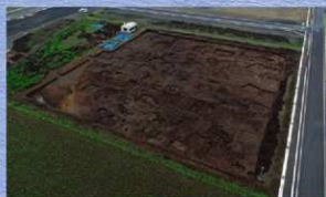
1区上空撮（北西から）