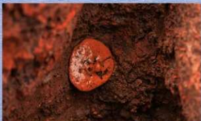
竪穴建物跡のカマド内から出土した鏡形土製品