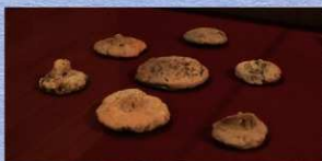
数多く出土した土製土製品