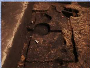
1号竪穴建物跡（西から）