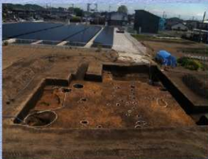
調査区全景（西から）

仮鉄塔建設工事に伴い発掘調査を実施しました。その結果、平安時代の竪穴建物跡1軒、平安時代から中世の横列2墓、近世の堀1条、平安時代から中世の井戸4基、近世の井戸1基、平安時代から中世のビット31基が確認されました。また、平安時代から中世の土器片が出土しました。このことから、この地域では、古代から人々の生活が営まれていることが分かりました。