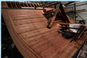
屋根下地修復状況（南西から）