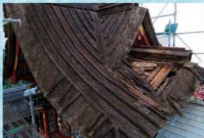
古い銅板を撤去した屋根（屋根南面・南西から）