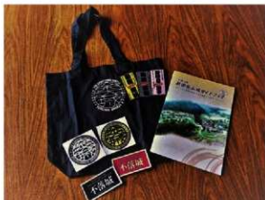
オリジナルグッズ（トートバッグなど）