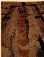
前橋天神山古墳の埋葬施設(粘土器)

江戸時代には瘡瘻(天然痘)除けとして赤色を用いられ、「だるま」や「赤べこ」などが広まった。