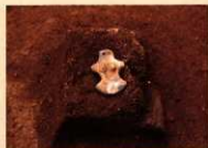
元総社蒼海遺跡群(13) 板状土偶出土状態

また、子供の健康を祈る儀式「懸衣納め」との関連が考えられる「埋甕」は、荒砥前原遺跡C区(前橋市二之宮町)や横沢築崎遺跡(前橋市横沢町)の縄文住居跡に敷設されており、横沢築崎遺跡の柄鏡形敷石住居では張り出し部分の先端と本体との連結部の2か所から埋甕が見つかっている。