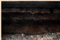
英井八日市遺跡 弘仁地震に伴う噴砂