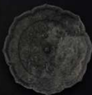
八椀鏡 高崎市長兼高崎市長（旧）平安時代