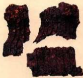
保渡田八幡塚古墳 小札甲(挂甲)の破片

先人たちは、時に敵を迎え撃って防ぎ、防御のため「防具」も進化した。古墳時代(5世紀末)築造の保渡田八幡塚古墳(高崎市保渡田町)に副葬された小札甲(挂甲)は、鉄や革の小さな板をつないで動きやすく工夫され、朝鮮半島から伝来したての優れた防具だった。その後、日本の甲冑は小札甲から発展したとされる。