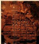
上野国多胡郡正倉跡の法倉跡