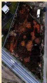
秋窪倉兼Ⅲ遺跡全景

「子主井井」 シ と刻まれた平安時代(9世紀)の土器がある。「 シ 」(氏族名)「主」(名前)が、九字によって護身を願ったことわかる資料である。