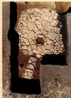
横沢築崎遺跡 柄鏡形敷石住居

「土偶」は、一般的に子孫繁栄を祈願してつくられたとされ、元総社蒼海遺跡群(13)(前橋市元総社町)や八幡山遺跡(高崎市山名町)出土の土偶は分銅型(ヴァイオリン型)をした「板状土偶」と称される。縄文時代前期に作られ、2つの穿孔で目を、突起で乳房を模して女性の姿を表現している。