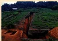
前橋北曲輪跡 高崎市北曲輪跡

に囲まれた微高地上に築かれ、内堀と土塁に囲まれた内庫に水を溜えた外堀が囲み、内部はさらに中堀で区画される。