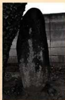
廻国供養塔(高崎市正観寺町龍泉寺) 享和3(1803)年

さて、廻国塔には「天下泰平」「国家安全」などの文字が刻まれている。江戸時代は200年以上泰平の世が続いたことで知られるが、一方で災害や飢饉が発生し、疫病が流行した。そのため廻国行者が村に立ち寄ると、人々は仏に平和を祈って「天下泰平」のありがたさを碑に刻んだのである。