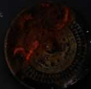
銅鏡「高原の歌鏡系」 高崎市長兼高崎市長（旧）古墳時代