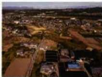
上野国多胡郡正倉(法堂)跡