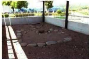
高田遺跡群敷石住居跡