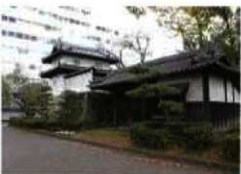
移築された高崎城跡門と東門