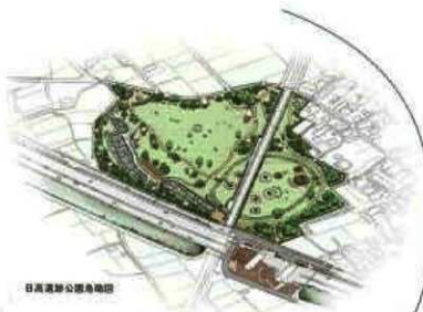
日高遺跡公園鳥瞰図