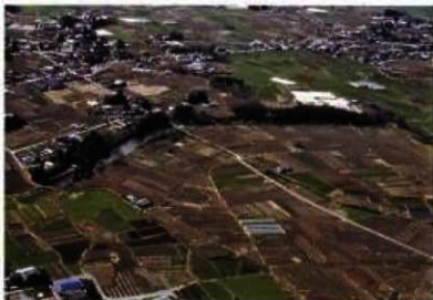
女堀(二北宮地区地下地点)

これまでの調査成果から、昭和58(1983)年国史跡に指定され、前橋市内4地区6地点、伊勢崎市内で1地区が指定されている。前橋市でも保存活用計画を策定するなど、史跡を整備・活用することに取り組んでいる。国史跡指定日：昭和58(1983)年10月27日