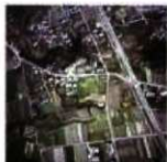
北谷遺跡航空写真

同古墳に近接して「かみつけの皇博物館」があり、古墳群の説明や出土遺物等を見学することができる。