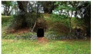
観音塚古墳石室入口