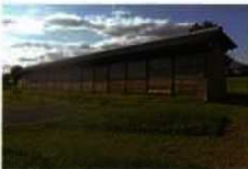
復元された国分寺跡