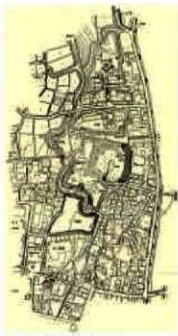
大胡城周辺地形図(平成13年)