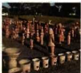
八幡塚古墳の埴輪群像復元