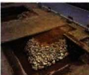
北谷遺跡掘り出し部分の石積み