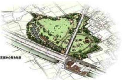
日高遺跡公園鳥瞰図

弥生時代になると前期から中期にかけては墓跡、中期後半から後期では遺跡が丘陵地から低地に分布範囲を広げる傾向があることがわかってきた。集落跡・水田跡・墓跡など居住・生産・墓地が一体となって確認できた日高遺跡などがある。日高遺跡は史跡公園として現地において保存し、一部復元した姿を見学することができる。