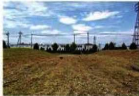
女堀(東大塚地区東神沢地点)