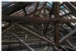
小原 平兵衛の重要「資賢閣」第二十二六〇口口口