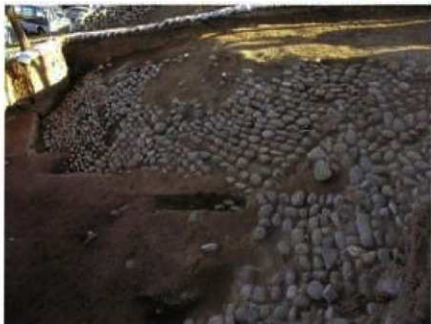
遠見山古墳くびれ部調査風景