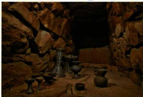
前二子古墳石室と復元設置された土器類