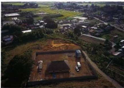
内堀遺跡群調査風景

縄文時代の赤城山の南麓は、集落遺跡の密集地で、五代遺跡群の縄文時代前期～中期の集落からは、赤城山の南麓の地域で作られた土器以外に南関東・茨城県・東北地方・北陸地方などに特徴的な文様が描かれた土器が多数出土した。このことは縄文時代に遠くの地域とも交流があったことを示している。