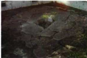
長井旧石器時代遺跡