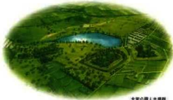
大塚公園と古墳群