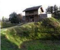
復元された箕輪城跡の西虎口門