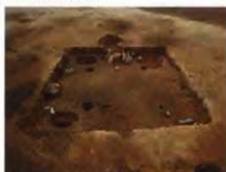
竪穴住居跡(五代伊勢宮遺跡)

竪穴住居の縮小化が進むにつれ、竪穴を掘らず平地に柱穴を掘って柱を立てる掘立柱建物が一一般化し、中世になると竪穴住居は姿を消す。