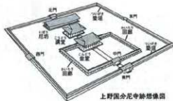
上野国分尼寺跡想像図

出土した瓦には、上野国分寺(僧寺)の創建期と同様の「単弁五葉蓮華文」や「備行唐草文」が散見され、上野国分寺では、僧寺・尼寺の建立時期にさほど差が無い可能性がある。また平成20年の推定伽藍南辺外側の調査では、土坑内から須恵器壺(8世紀後半)が3点出土し、尼寺と関連する仏具と考えられている。