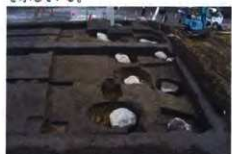
八幡中原遺跡6次調査で発見された大型礎石建物跡

八幡中原遺跡から南へ約600mのところに八幡六枚遺跡がある。ここでは「片岡郡」と刻まれた土器が出土しており、この地域周辺が片岡郡の中心であったことを示している。