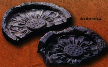
山王廣寺・軒瓦瓦