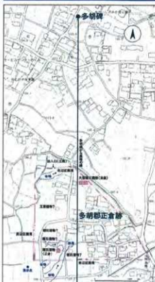
多胡郡正倉跡と多胡碑との位置