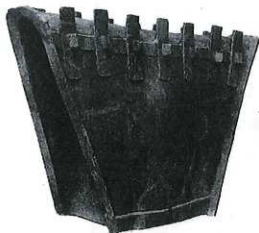
第3図 瀬戸ヶ谷古墳出土家形埴輪（再掲）

の記述があることから、家形埴輪の基底部が残存していたと推定される。本図上頂は前回の図から周囲の埴輪片を取上げた後の状況を記録したものと考えられるが、箱形の表現は認められないことから、下から出土した状況について後に追記したものであろう。 第4図は瀬戸ヶ谷古墳全体の埴輪の出土位置図である。まずこの図の作成年代についてであるが、目を引くのが下頁右側に書かれた記述である。右側には「昭和25.1.22 横須賀考古学会●発掘16個(?)円筒埴輪列」と記入されている。本方眼ノートについては、掲載を開始する際表紙に「昭和18年」の記載があること、鉛筆・マジック・青字（インク）が認められること、鉛筆の記載をマジック・青字でなぞっている点を鑑み、記録作成当初は鉛筆書きだったものを、後の資料整理の際にマジック・青字でなぞったものと推定した（『瀬戸ヶ谷古墳（5）』研究紀要15）。また、冒頭で触れたように一連の出土状況図には日付が書かれており、『瀬戸ヶ谷古墳（7）』研究紀要18』で紹介した図にはインクで「18年8月1日」の記述が認められる。以降紹介した資料には年の記述は無く月日のみが書かれているが、『瀬戸ヶ谷古墳（8）』研究紀要23』では、8/1の記載がある出土概略図と8/11の記載がある出土状況実測図は同一個所の図であり、『瀬戸ヶ谷古墳（1）』研究紀要12』に掲載した写真も含めて一連の調査過程を記録したものとして判断した。そして記載方法が同じ本稿第1図の11.28も冒頭で述べたように同一年のものと推定した。本図は古墳の形状と三重に巡る埴輪の出土位置が描かれているが西側を中心に別のインクで「人」「馬」「円筒列」「この辺に形象」などの記載とその位置を示す「○」が一部追加されている。今まで紹介してきた出土状況図は基本的に鉛筆の記載をマジック・インクでなぞったものに一部追記を行っているが、本図は後円部の北西側の一部のみに二段目の波状のラインがあり、それよりやや埴輪頂部にインクでラインを追記している点以外は元図をなぞった跡は認められず、今まで紹介してきた出土状況図とは異なる形で描かれている。以上のことから、まず本図の最終的な追記を実施した時期は昭和25年1月22日以降と考えられる。また、当初の作成時期については本図からは推定することが困難であるが、出土状況図と筆記具の記載手順が異なるため、昭和18年時の一連の出土状況図とは異なる時期の可能性も考慮すべきと思われる。