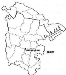
第1図 対象遺跡位置図