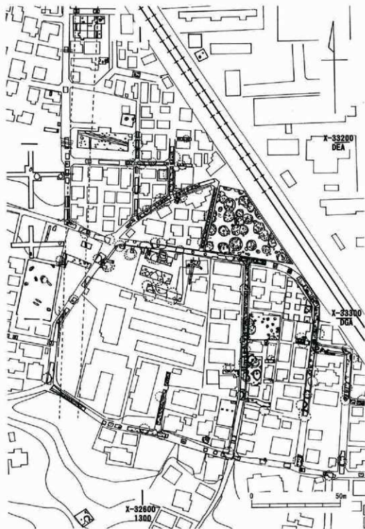
第3図 調査地の位置