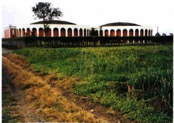
調査対象地 (東から)