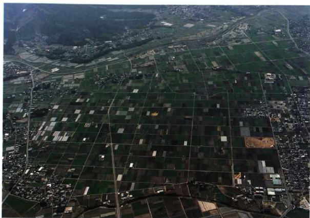
図版 4 宮ノ原地区遠景（北から）