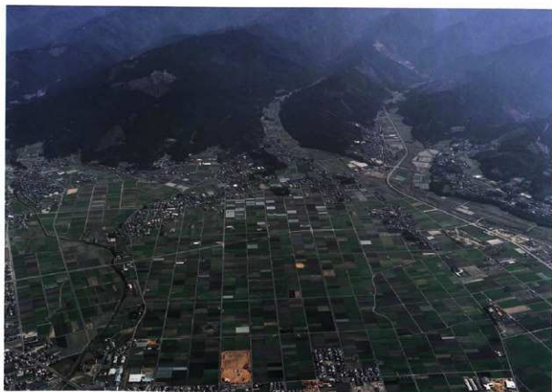
図版 5 宮ノ原地区遠景（西から）