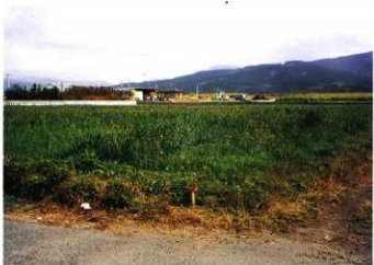
調査対象地 (西から)