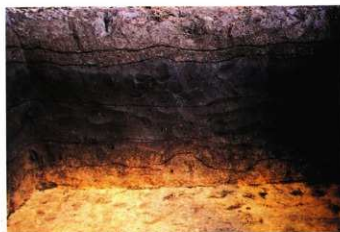
図版1 基本土層断面