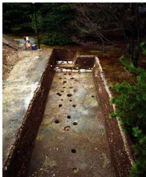
写真2 調査区の全景 道路・楯列・築地跡（西から）