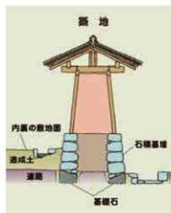
図2 寛政度内裏築地の推定断面図

で絵図などでしかわからなかったのですが、一部ながら発見遺構を通じて具体的に解明できました。