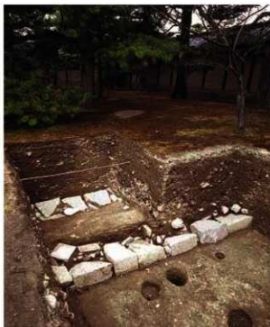
写真3 寛政度内裏の築地跡（北西から）

発見遺構 今回のおこな発見遺構である寛政度内裏の築地跡を、より理解しやすいように古い時代の遺構から順に紹介していきます。