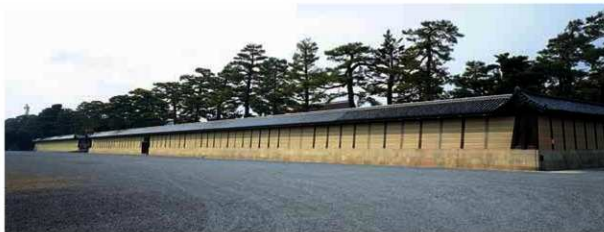
写真1 現在の京都御所 南面築地(南東から)

はじめに 京都御所は土で造られた立派な塙に囲まれています。このような土塙を築地と呼んでいます。御所の築地は5本の白い横筋を壁に入れて石積基壇の上に築かれており、その姿は御所の威厳と風格をそなえています(写真1)。