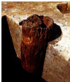
写真2 竪穴住居の主柱根