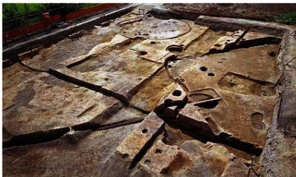
写真1 排水施設と大型住居 (北東から)

はじめに 向日市と接する京都市南区久世 くせ 城町では、向日町上島羽線の街路建設工事が進行中です。これに先だって1997年からこの地域では発掘調査を行ない、現在も継続しています。1998年度は国道171号線から東へ約230m付近までが調査対象となりました。