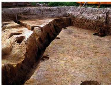
写真3 壁溝に残る板材と側柱跡