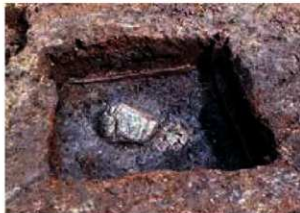
写真2 土器田出土 平安京右京三条三坊九町 花園大学構内調査報告 同大学考古学研究室 1998年