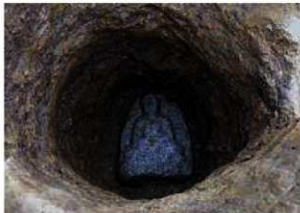
写真3 石仏出土 平安京左京三条三坊十一町 平安京跡研究調査報告第12輯 (財)古代学協会 1984年