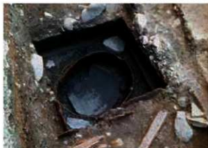
写真4 大型の土器片出土 平安京右京七条二坊十二町