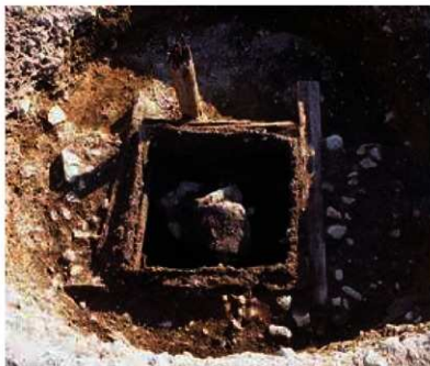
写真1 大石を入れた井戸 平安京左京八条二坊十四町