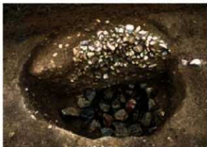
写真5 準大のグリ石出土 勝龍寺城跡 勝龍寺城跡発掘調査報告 長岡京市埋蔵文化財センター 1991年

ている状態で見つかる例が多いのも偶然とばかりはいえず、何かを意図していたようです。これは石組井戸の場合も同様です。