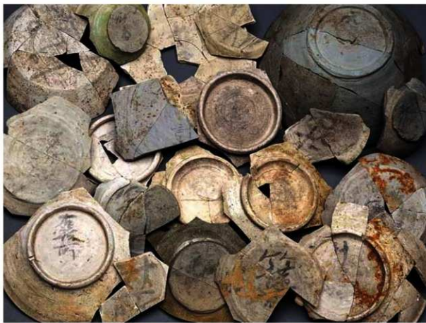
写真1 出土した墨書土器

はじめに 1996年10月から翌年10月にかけてJR二条駅西側の複合文化施設建設予定地で発掘調査を行いました。調査地は平安京右京三条一坊三町にあたり『拾芥抄』の付図「西京図」には「右京職」と示されています。右京職とは右京の行政・司法・治安にあたった役所のことで、朱雀大路をはさんで右京・左京の両職があったとされています。