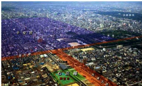
写真2 調査地付近を望む