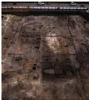
写真3 建物跡と墨書土器が出土した溝(北から)

出土した墨書土器から右京職の位置が特定できました。また、右籍所や籍所という新たな役所の部署の存在を知り得たことは、平安時代の行政システムの解明につながる大きな発見であったといえるでしょう。(伊藤 潔)