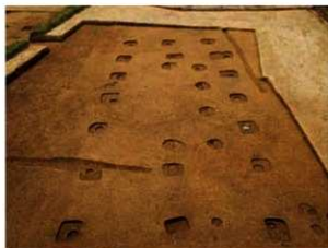
写真2 建物4 内部の浅い穴は、礎を据え付けた跡か、あるいは床張り施設の跡とも考えられる（東から）