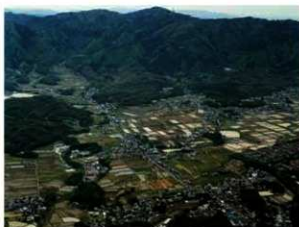
写真3 遺跡付近の航空写真（南東から）

建物1・2・5に囲まれた空間に掘られているため、このグループに属するものとみられます。