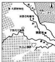
図1 調査地付近のようす

このうち、建物規模がもっとも大きい茶色で示したグループでは、建物1・2・4の東端の柱筋や建物2・3・5の南端の柱筋が