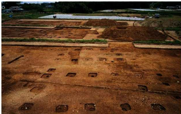
写真1 大原野松本遺跡で発見した掘立柱建物群 手前から建物2・建物1（北から）

京都市の西南に位置する大原野は、古代より「弟国」「瓊国」、また大宝令の制定後は「乙訓」と呼ばれた地域に属します。この大原野では、1981年より農業土地改良事業が実施され、それにとまなう発掘調査を行なってきました。今回は、1996年3月から5月にかけて調査した奈良時代の建物群について紹介します。