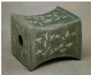
写真2 青磁象嵌葡萄枕 海剛陶磁美術館蔵

この枕は室町時代の層から出土したが、文様ならびに釉の発色などから製作時期は13世紀と考えられる。しかし、その時期がそのまま日本への請来時期とは限らないようである。1320年代、日本に向けて航行中に韓国の新安沖で沈没