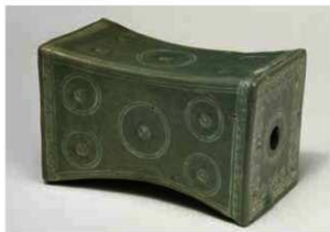
写真1 青磁象嵌枕 高麗美術館蔵

美術館所蔵のもの(写真1)があり、その枕を手がかりにして全体の文様構成をある程度復元することができる。側面は丸い透かしを中心に、外側から界線、菊花文、珠文帯を描く。前後面は側面に雷文、如意頭文をおき、中央の圓鏡を中心にして四隅に弧線を配し、その隙間を埋めるように菊花文をおいたものと考えられる。この場合、透かし穴の径を2.8cmとすると枕の高さは11.0cm、幅は8.8cmになり、枕の長さは14.0cmになる。上下面は前後面と同様に側面に雷文、如意頭文を描く。その内側には珠文と線文がみられるが復元は難しい。ただ韓国の海剛陶磁美術館の青磁枕(写真2)の葡萄文を参考にすれば、珠文の集まりを葡萄の房、線文をその蔓とみることも一案であろう。また、上下面と前後面との境は面取りし、珠文帯をおいている。