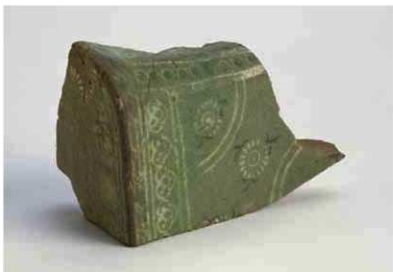
発見された高麗青磁象嵌枕片

枕の透かしのある側面は長方形になっており、側面の長い部分を立てた状態で、上あるいは下になる部分を上下面、横になる部分を前後面と呼んでおく。ただし上下面にだけ頭をおくのではなく、前後面も同じように使用されただろ