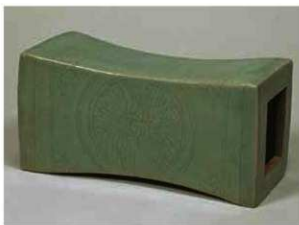
写真3 青磁双鶴文枕 大阪市立東洋陶磁美術館蔵

したとされる船の荷に、12世紀後半に製作されたと考えられる青磁枕がふくまれているのである。この青磁枕は彼の地で伝世された後に船積みされたと思われる。