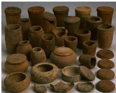
焼塩壺(後列)と花塩壺(前列) 江戸時代の町家跡(烏丸通五条)から出土

http://www.kyoto-arc.or.jp (財)京都市埋蔵文化財研究所・京都市考古資料館