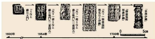
泉州漢系焼塩壺の刻印の変遷 (渡辺誠「物資の流れ—江戸の焼塩壺—」『季刊考古学』13 1985 雄山閣)を改定

器としての花塩壺も丁寧で可愛らしくつくられており、用途も焼塩とは少し違ったものと考えられます。例えば、岡崎の遺跡からは江戸時代のカマドの下から五個一組で並べられて出土しており、祭祀に使われた可能性があります。また、刻印には焼塩屋の銘だけでなく瓦屋の銘もあり(下図①③)、近年までは瓦屋が盆や暮れなどに配ったという例もあったようです。