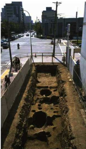
通常の位置の六条坊門小路跡 (北から)

調査区奥の小石を敷いてある部分が路面。時期は11世紀。写真真央は烏丸五条の交差点。