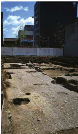
つけかえられた六条坊門小路跡 (西から)

調査区奥の小石を敷いてある部分が路面。時期は11世紀。写真真央は烏丸五条の交差点。