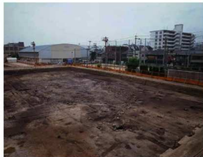
右京三条二坊十六町の邸宅と園池

寝殿造の要素をそれぞれに持つものはあってもすべてを備えるものはありません。建物が独立するものや廊で繋がれるもの、池を中心とした庭園の有無など様々です。