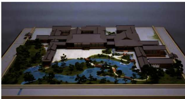
東三条殿 (模型 京都府京都市文化博物館所蔵)

http://www.kyoto-arc.or.jp (公財)京都市埋蔵文化財研究所・京都市考古資料館