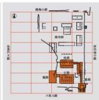
右京六条一坊五町