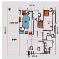
右京三条二坊十六町