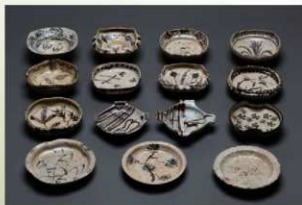
志野織部・志野 皿・向付