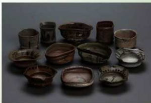
唐津 香茶碗・向付