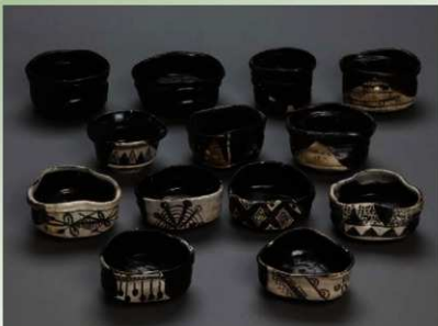
黒織部・織部黒 香茶碗

中之町東側に位置する弁慶石町・下白山町・福長町からも、同じ時期の多量の茶陶が出土しており、三条通沿いの東西わずか200m程度の範囲に類似する遺跡が集中していることが明らかになってきました。これらの茶陶には、生産地の窯で焼成する際に用いられた窯道具が付着したままのものがあり、多くは使用された痕跡が認められないことから、実際に使用されたものではなく、商品として店舗で保管・陳列されたものであったと