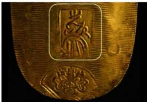
図4 前期慶長小判金

た。金の含有量や不純物に差があるのは精錬技術に由来するもので、当時の技術では1～3%程度の不純物が入ってしまうようです。さらに不純物の内容について調べると、両者と同じ11種類の微量元素が含まれていました。この結果から、二つの玩賞品は、同時期の技術により作製された可能性が高いと思われます。参考のため慶長一分判金の前期と後期の分析結果も掲載します。