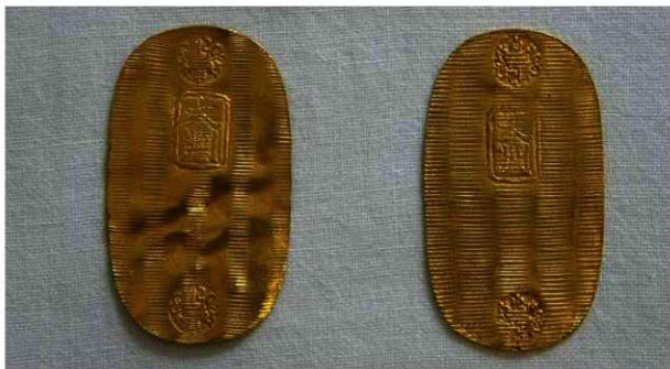
図1 左 桐小型大判金、右 女院大判金

玩賞品との出会い 皆さんは、 たらしあがり 玩賞品という古金銀をご存知でしょうか。いづろ作られたのかはよく分かっていませんが魅力ある骨董品です。数年前のある日、山形古銭店でどこか見覚えのある小判形の玩賞品を見つけました。見た目の可愛らしさに加え、小さいのに大判と刻印されていることが気に入りました。図1の右がその玩賞品です。縦41.2mm・横22.8mm・厚さ約0.4mm・重さ4.88gあり、表面の上下にある裸桐刻印は、 たらしあがり 鋳打ちされています。調べてみると、これは、江戸時代後期に出版された『金銀図録』近藤重蔵(守重)著文化7年(1810)玩賞品巻六に掲載されている“女院大判金”であることが分かりました。しかし貨幣