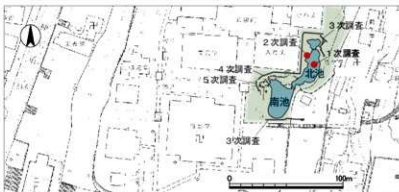
図1 知恩院方丈庭園とその周辺