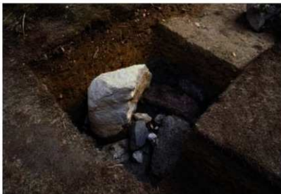
写真2 2次調査 景石と土臺 (北西から)