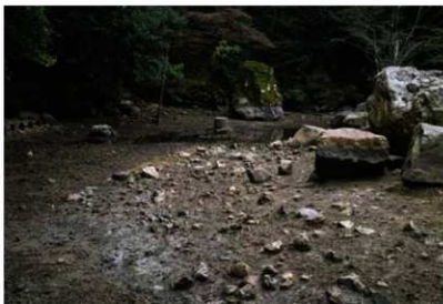
写真1 1次調査で見つかった浜派状の池底 (北西から)