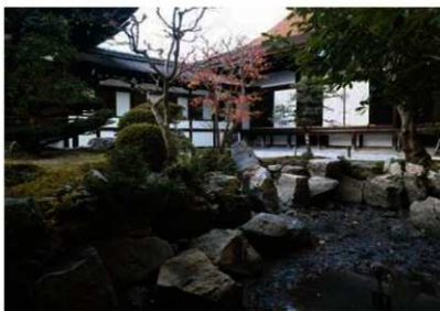
写真3 北池 西岸の石組(南東から)

調査の概要 庭園整備にともなう調査として2005年から2007年にかけて2回(1・2次)、庭園内の防災工事にともなう調査として2011年と2012年に3回(3～5次)実施しました(図1)。1次調査では洲浜状の池底や、池の東側斜面の滝組から石橋までが一連の石組であったことがわかりました(写真1)。2次調査では汀が緩やかで洲浜に続くこと、現在の陸部