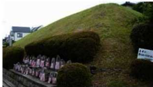
21 史跡 御土居 北区平野鳥居前町 1930年指定

住宅地の一角で、民家に囲まっていますが、わずかに面影を残しています。西土居町という地名からも、御土居の名残が感じられます。