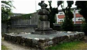
24 史跡 方広寺石臺および石塔(馬塚) 東山区正面通大和大路東人茶屋町1989年指定

豊国神社の西、正面通の南側にあり、墳丘の上に大型の五輪塔を安置するもので、江戸時代の文献や絵図に「耳塚」が描かれています。