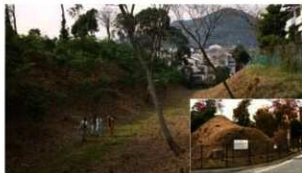
17 史跡 御土居 北区大宮土居町 1930年指定

残存する御土居の中でも保存状態が良く、長さ約250mにわたる土塁と堀が残ります。土塁上には竹林があり、当時の御土居の姿がしのげられます。