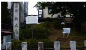
20 史跡 御土居 北区紫野西土居町 1930年指定

1981年に史跡公園として整備され、地域住民の憩いの場となっています。土塁の頂部まで登ることができ、その高さを体感できます。