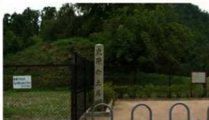
18 史跡 御土居 北区鷹峯旧土居町 1930年指定

残存する御土居の中でも保存状態が良く、長さ約250mにわたる土塁と堀が残ります。土塁上には竹林があり、当時の御土居の姿がしのげられます。