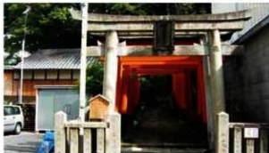
22 史跡 御土居 中京区西ノ京原町 1930年指定

台形の土塁に芝が植えられており、史跡の中でも、その形状が最も良くわかります。道路脇には御土居やその周辺から出土した石仏が祀られています。