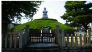
23 史跡 方広寺石臺および石塔(耳塚) 東山区正面通大和大路東人茶屋町1989年指定

土塁に接して社壇があり、御土居そのものが市五郎稲荷神社として信仰の対象になっています。鳥居が並ぶ参道部分が堀跡といわれています。