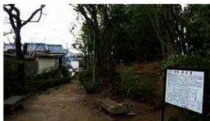
19 史跡 御土居 北区鷹峯旧土居町 1930年指定

御土居の北西角にあたります。御土居跡の東前には南北方向に旧道・鷹ヶ峯街道（千木通の延長）が通り、御土居の出入口・七口のひとつである長坂口にあたります。