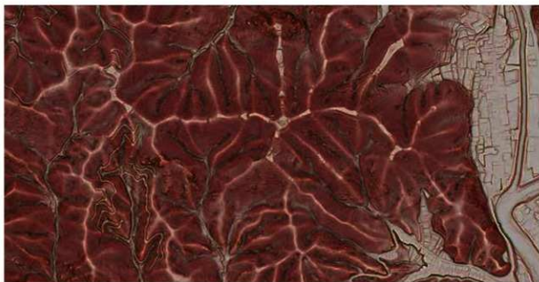
図1 周山城跡赤色立体地図

http://www.kyoto-arc.or.jp (公財)京都市埋蔵文化財研究所・京都市考古資料館