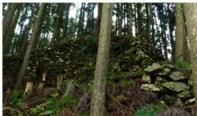
写真1 東の城 廓Ⅴ北面石垣（北から）

周山城は光秀による丹波支配の拠点の一つで、若狹と京を結ぶ周山街道を抑える地点に築かれました。見渡す限り山ばかりの地での城造りは困難を極めたはずで、福知山城・亀山城・周山城を築城した光秀の卓越した能力がうかがえます。