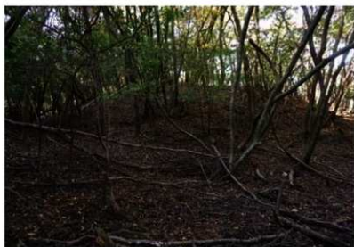
写真1 松尾山古墳群 1号墳 (南西から)

な場合に非常に有効な手段です。図では、傾斜が急な面が赤く、尾根は明るく、谷は暗くなるように表現されています。古墳は小山のような形で図に表れます。