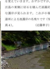
写真4 小堀遠州による池護岸の名残り