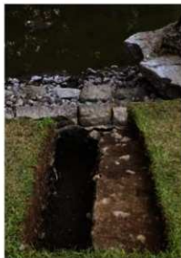
写真2 調査1区（北西から）