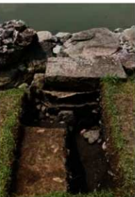
写真3 調査2区（東から）