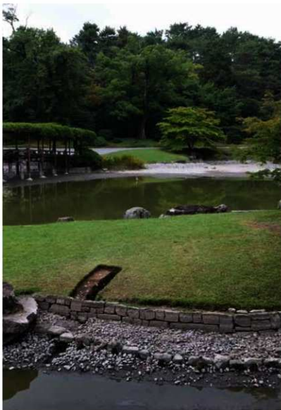
写真1 調査地全景(東から)