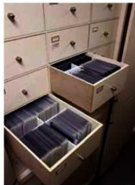
フィルム保管のようす

当研究所には45年間に撮影した21万枚以上のフィルムがあり、温度を管理した部屋で湿度を調整できる桐製の引き出しに入れて保管しています。必要な時にすぐ取り出せるようにすべてのフィルムに調査地の記号と番号を割り振って、台帳で管理しています。さらにスキャニングをしてデジタルデータとしても保存管理しており、その一部は当研究所ホームページの写真データベースよりご覧いただけます。(九鬼みずほ)