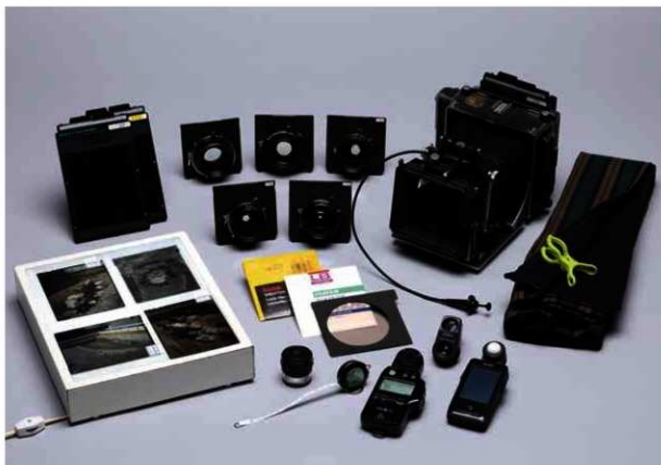
撮影に使用する大判カメラの機材セット

http://www.kyoto-arc.or.jp (公財)京都市埋蔵文化財研究所・京都市考古資料館