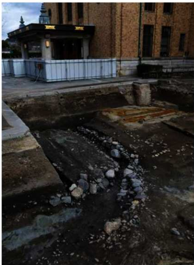
写真1 京都市美術館の調査で出土した石で埋戻された溝 (南西から)

文献史料による推定地と発掘調査成果が合致し、その位置が確定しているのは法勝寺、尊勝寺、最勝寺です。現在の京都市動物園からその北側一帯にかけて法勝寺、ロームシアター京都付近から北西側にかけて尊勝寺、岡崎公園グラウンド西側の辺りに最勝寺が位置します。円勝寺の位置については、