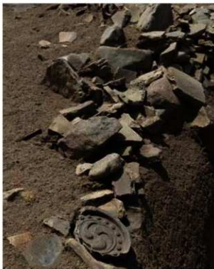
写真3 瓦の出土状況 (北東から)