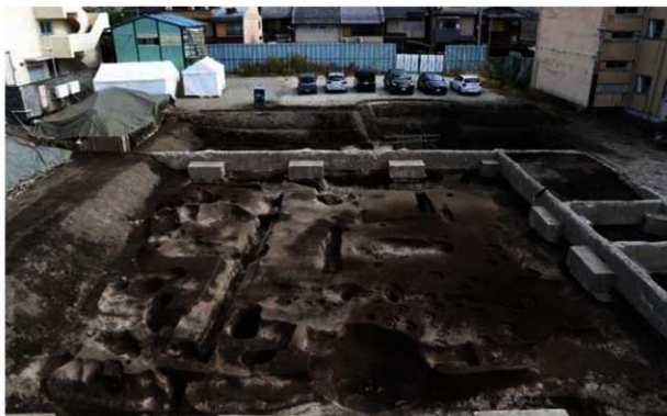
写真1 調査区南半 鎌倉時代の遺構全景(西から)

はじめに 吉田神社や京都大学吉田キャンパスがある吉田地域は、平安時代後期頃から開発が進み、天皇や上皇・皇族の御所や寺院などが建ち並ぶ白河街区の一画として栄えていました。白河街区の南部では、法勝寺をはじめとして寺院や御所などが発掘調査により確認され、その姿が少しずつ明らかになってきています。一方、白河街区の北部がどのような姿をしていたのかについては、いまだに不明瞭な部分が多く、はっきりとわかっていません。今回、史料から白河街区の北部にあったとされる「福勝院」推定地である京都市近衛中学校で2020年7月から12月