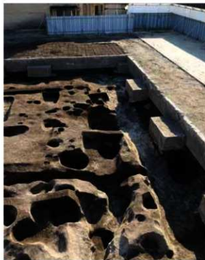
写真2 南北方向の溝 (北から)