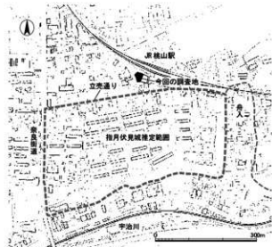
図2 指月伏見城推定範囲と今回の調査地

ます。大名屋敷の石垣は南北方向に築かれており、指月伏見城の石垣基礎部とは直交しません。施工の方位が異なっています。さらに、大名屋敷の石垣が指月伏見城の石垣の一部を壊して構築されていることから、2つの石垣に時期差があることは確実です。