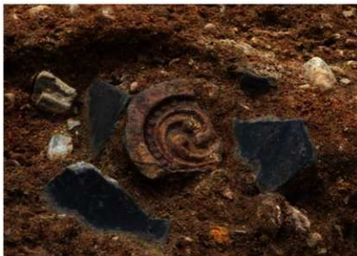
写真2 石垣を埋めた土からは金箔を貼った瓦が出土した