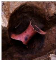
写真3 器台と高環を埋納した柱穴 柱穴は直径28cm・深さ58cmで、底から25cmの位置に器台が、さらにその下には高環が埋められている。