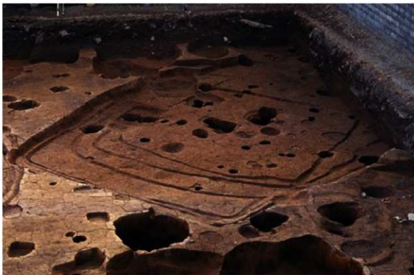
写真1 重複して建て替えられた竪穴住居跡

年の瀬も迫る2006年の跡走から約一月半に渡って調査した西京極遺跡で、弥生時代後期前半(約1900-2000年前)の竪穴住居が8棟見つかりました。これらは、同じ場所に何度も連続して建て替えを行なっていることや(写真1)、炉の規模が建物の総面積に対して非常に大きいことなどから、特殊な建物ではないかと注目されました。実は、それに加えて、竪穴住居を壊す時に行なったマツリのあとも見つかっています。