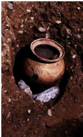
写真2 甕を埋納した柱穴

柱穴は直径22cm・深さ49cmで、底に石を並べ、その上に底部を打ち欠いた甕を据える。右上は、10分の1の実測図。右下は、甕発見時の様子。