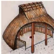
図1 竪穴住居の構造

竪穴住居の構造 見つかった遺構を紹介する前に、弥生時代の竪穴住居がどのような構造だったのか簡単に説明しておきます。時期や地域、立地条件などによって異なることもあるため一概にはいえませんが、弥生時代後期の竪穴住居は図1のようであったと考えられます。まず地面を掘りくぼめ、