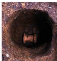
写真4 器台を埋納した柱穴

柱穴は直径35cm・深さ65cmで、底から22cmの位置に器台が埋められている。