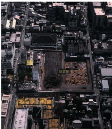
調査地と周辺(北から)

では、伏見城が建設される前の伏見はどのようなようすだったのでしょうか。2005年から2006年にかけて行なった伏見区総合庁舎整備事業にともなう発掘調査では、伏見城が建設される前の集落を発見することができました。