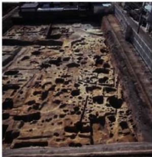
北西部の柱穴列・区画溝・井戸(北から)