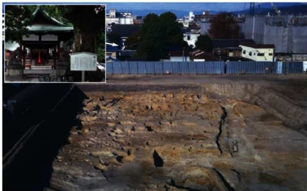
調査地と金札宮（南から）

見つかった遺構には柱穴列・大溝・溝・井戸などがあります。出土した遺物から今から約400～500年前の室町時代後期の遺跡であることがわかりました。伏見城城下町が建設される直前の時期です。城下町建設は非常に大規模な土木工事であるため、それ以前の遺跡の多くは破壊されてしまいます。ところが、西に向かって傾斜する緩やかな斜面の、東側の高い部分は削り取られていましたが、西側の低い部分は整地のための盛土で覆われたことから遺跡がのこされていました。