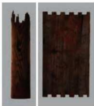
引き揚げられた遺物