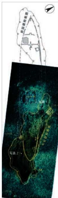
船体検出状況と解釈図(1:300) マルチビーム音響測深器による画像