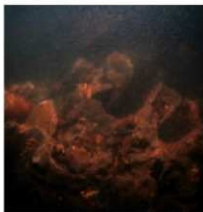
写真1 ボイラーパイプの状況

さらに、海底付近はほとんど視界がありません。視界のよい時でも、伸ばした指先がやっとみえる程度です。掘削すると濁りのために全く見えません。まさに手探りの作業です。