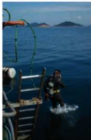
潜降を開始する調査ダイバー

次に、27mという水深が立ちほだかりました。水圧の関係からダイバーの潜水作業時間は1回40分、1日2回が限度です。しかも、作業後は水中で約20分間減圧をしなければ浮上できません。